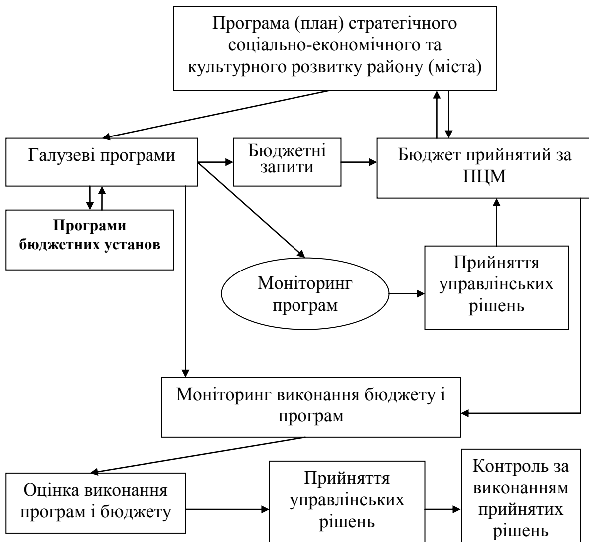
Рис. 2. Модель програмно-цільового бюджетування

Визначено, що удосконалення механізму формування доходів місцевих бюджетів неможливе без зміни підходів до організації і проведення бюджетного процесу, який полягає у запровадженні середньострокового планування доходів і переході від діючої форми утримання бюджетних установ до фінансування цільових середньострокових програм, де бюджетні кошти виділяються під конкретну мету. Сучасною формою організації бюджетного процесу на сьогодні є програмно-цільовий метод (ПЦМ), сутність застосування якого полягає в здійсненні бюджетного процесу на центральному, галузевому і регіональному рівнях відповідно до програм, які зорієнтовані на досягнення мети і кінцевого результату. Моніторинг програмних показників діяльності бюджетної сфери при застосуванні ПЦМ дасть можливість оцінювати ефективність використання бюджетних коштів, досягнення мети при реалізації бюджетних програм, для чого автором розроблено і запропоновано для практичного застосування модель програмно-цільового бюджетування (рис.2).