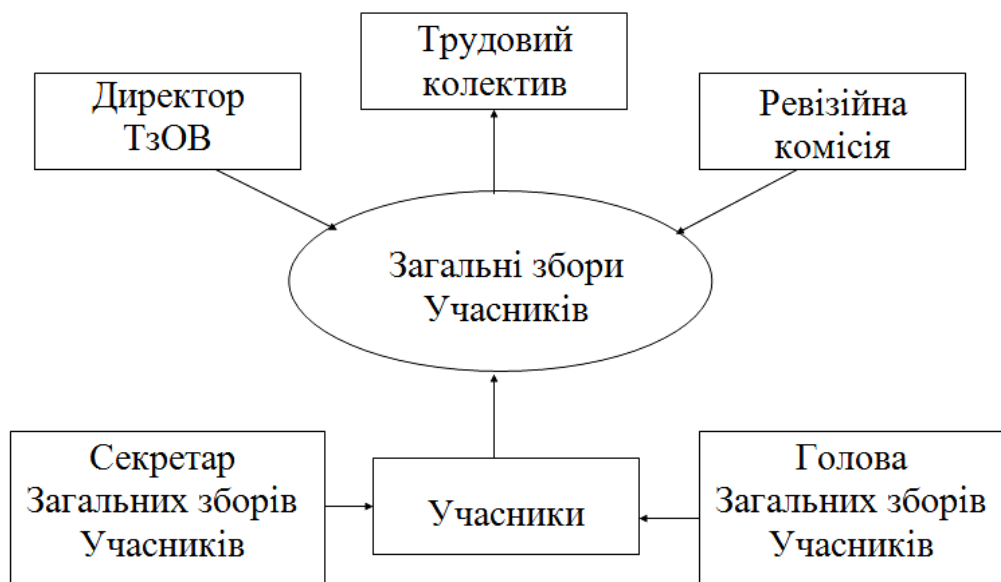
Рис. 2. Управлінська структура підприємства ТзОВ „Городище”

Управлінська структура ТзОВ „Городище” складається з декількох ланок, які взаємоузгоджені між собою (рис. 2). Вищим органом управління підприємства є загальні збори учасників товариства. Представники можуть бути постійними або призначеними на певний строк. Збори обирають голову загальних зборів учасників та секретаря загальних зборів учасників. Директор ТзОВ та жоден з членів ревізійної комісії не може бути обраним головою зборів або секретарем зборів.