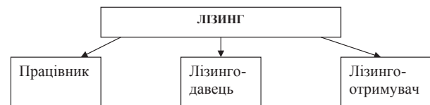
Рис. 2. Класична схема лізингу

Лізинг – це специфічна форма оренди робочої сили, яка передбачає надання лізингодавцем лізингоотримувачу робочої сили у тимчасове користування.