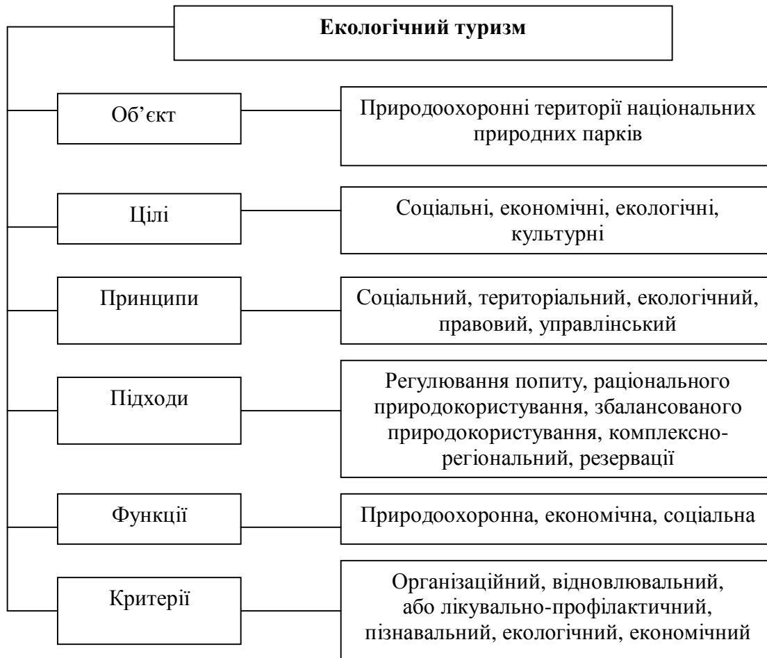
Рис. 1. Складники визначення сутності екологічного туризму

Екологічний туризм як бізнес або індустрія потрапив зараз під рубрику відповідальних методів ведення бізнесу й отримав визначення відповідальний туризм . Розуміння багатогранності рекреаційно-туристського використання території національних природних парків значною мірою віддзеркалює рівень їх цінності, визначає їхню роль у становленні соціальної свідомості людини, розвитку національної та регіональної економіки, дає можливість комплексно сформулювати цілі екологічного туризму, формуючи їх за визначеними підходами, у контексті яких ми його трактуємо, а саме: соціального, територіального, екологічного, правового, управлінського (рис. 2).