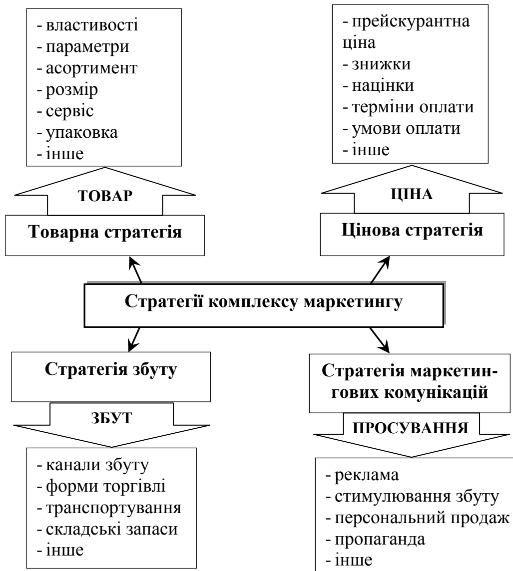
Рис. 2. Стратегії комплексу маркетингу

Отже, стратегії комплексу маркетингу – це сукупність стратегій, в основі яких лежать маркетингові засоби (товар, ціна, розподіл, просування), що дає можливість забезпечити досягнення поставленої мети та довгострокових маркетингових цілей.