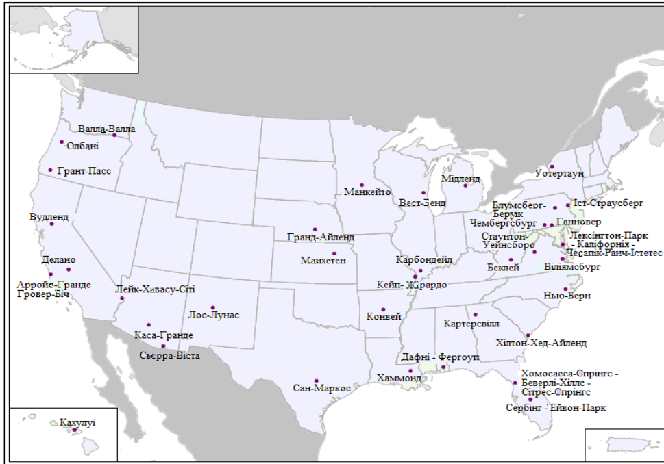
Рис. 2. Нові урбанізовані ареали на території США у 2010 р.

Ще однією ареальною формою системи розселення міського населення США є мегалополіси – обширні урбанізовані зони смугоподібної конфігурації, які утворюються в результаті фактичного зрощення багатьох сусідніх агломерацій різного рангу. Нині мегалополіси не є зоною суцільної міської забудови (вона займає лише близько 1/10 всієї території мегалополіса), тоді як останній простір займають котеджі, поля, ліси, транспортні шляхи, водоймища, вільні землі. Зазвичай такі урбанізовані смуги протягуються вздовж найважливіших транспортних магістралей і полімагістралей, або своєрідних економічних осей. У США ще у ХХ ст. сформувалися Північно-Східний (Босваш), Приозерний (Чипіттс) і Каліфорнійський (Сансан) мегалополіси, у яких нині проживає майже половина всього міського населення США.