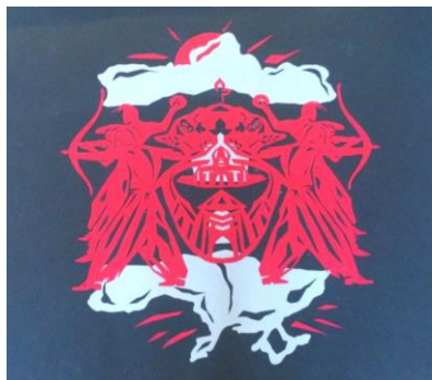
Рис.3. А. Бурдуковська «Козацька доба»