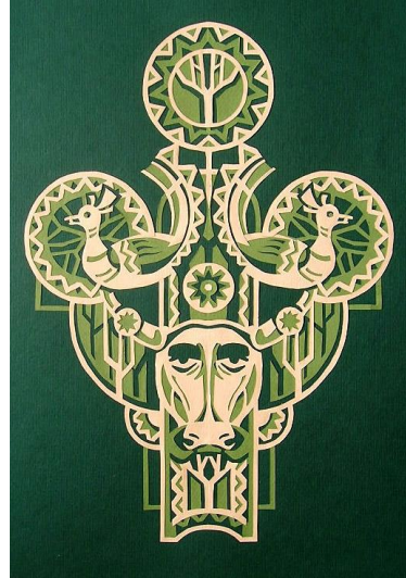
Рис.6. П. Порицький «Подих віків»

При цьому перед студентами ставляться творчі завдання привнести самобутнє, оригінальне у вирішенні теми, композиції роботи (Рис.5,6).