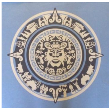
Рис.4. Ю. Вінчук «Знаки»

Для розвитку наявних умінь і подальшому перетворенню цих умінь у навички для студентів пропонується використати як елементи для орнаментальної композиції графічні зображення природних об'єктів, попередньо стилізувавши їх.