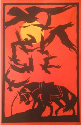
Рис.5. О. Юр'єв «Берестечко»

5. За допомогою аналізу і вивчення конкретної форми створення шляхом синтезу нової форми на основі їх початкової характеристики