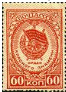
Марка СРСР, 1946 р.