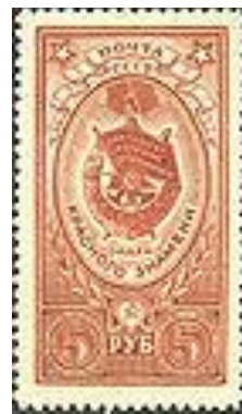
Марка СРСР, 1952 р.

У центрі ордена розміщений круглий знак, покритий білою емаллю, на якому зображені золоті серп і молот, обрамлений золотим лавровим вінком. Під круглим знаком розміщена перевернута червона зірка, під якою перехрещуються молот, плуг, факел і червоний прапор з написом: «Пролетарі всіх країн, єднайтеся!» Зовні орден обвитий золотим лавровим вінком, на яких розміщена червона стрічка з написом «СССР».