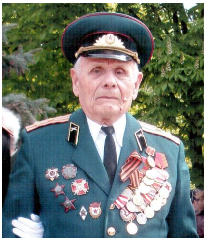
Бобер Микола Миколайович. Полковник. Нагороджений орденами Червоного прапора, Олександра Невського, Вітчизняної війни, двома орденами Червоної зірки