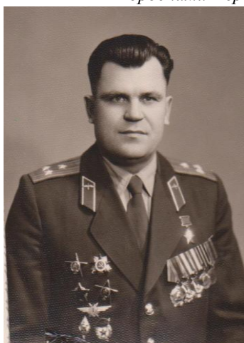
Герой Радянського Союзу Лизунов Леонід Іванович