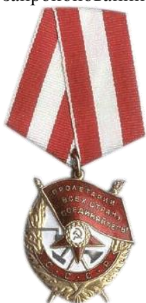
Орден Червоного Прапора