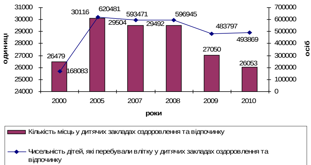
Рис. 2. Динаміка кількості місць у дитячих закладах оздоровлення та відпочинку і чисельності дітей, які перебували в них протягом 2000-2010 рр.

Динаміка кількості місць у дитячих закладах оздоровлення та відпочинку і чисельності дітей, які перебували в них протягом 2000-2010 рр відображена на рис. 2.