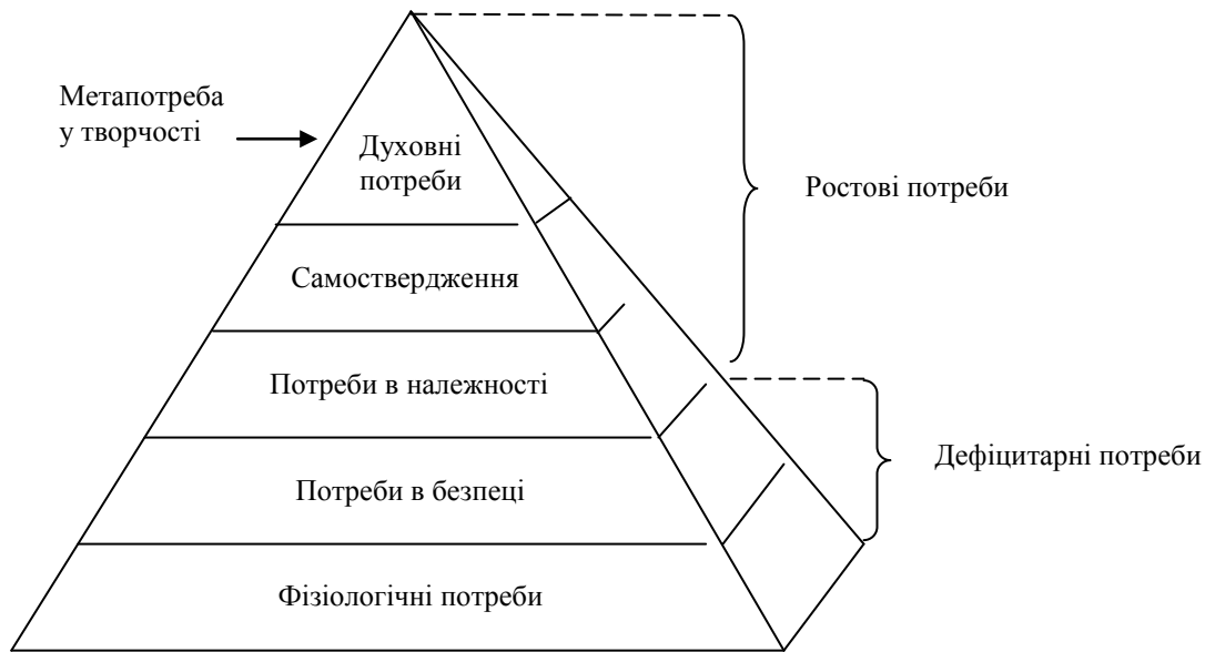
Рис. 1. Ієрархія потреб (за А. Маслоу)

Спільне для всіх теперішніх підходів у потрактуванні особистості – її соціальна природа. Особистість для педагогіки та психології передовсім виступає як суб'єкт соціокультурних відносин і свідомої діяльності (у широкому розумінні – особа ), а також як стійка відносно автономна система соціально значущих рис, що характеризують індивід як члена відповідного суспільства чи громади (колективу). Зазначимо: хоча поняття особа ( persona ) як вираз цілісності людини та «особистість» ( personalitas ) як прояв соціального та психологічного в ній – цілком розмежовані з наукового погляду поняття, їх часто вживають як синоніми.