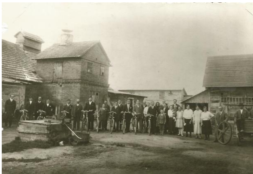
Фото 2. Підприємство Йозефа Прокупека. Луцьк, кін. 20-х – поч. 30-х рр. ХХ ст.