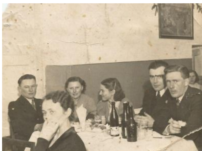
Фото 6. Святкування Різдва в Чеській Матіце шкільній. Луцьк, 1935 р.