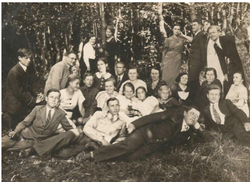
Фото 7. Члени товариства ЧМШ на відпочинку в Йозефіні поблизу Луцька. Орієнтовно 1938 р.