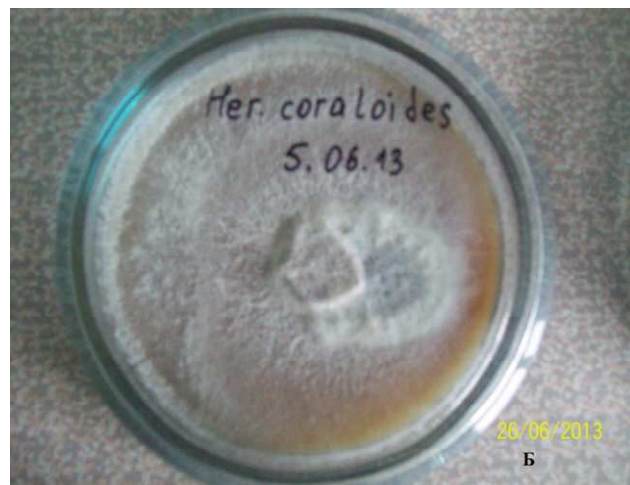
Рис. 1. Чиста культура Hericium coralloides . А – телеоморфа, Б – колонія