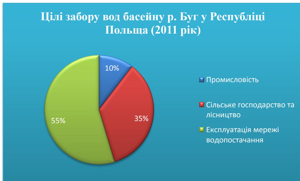
Рис.2. Цілі забору вод басейну р. Буг у Республіці Польща (2011 рік)

Забір вод басейну р. Буг на потреби національної економіки та здійснюється на цілі промисловості, сільського господарства та лісництва, експлуатації мереж водопостачання. Відповідно у відсотковому відношенні ці показники у 2009 році становили 10 %, 35 %, 55 %, у 2010 році – 10 %, 32 %, 58 %, у 2011 р. – 10 %, 35 %, 55 %, такі показники характеризують стабільну динаміку (Рис.2.)