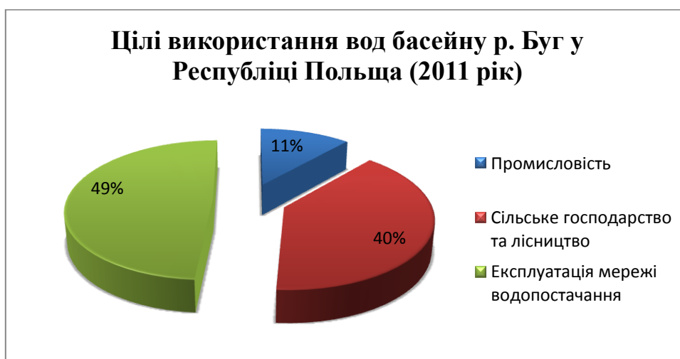
Рис.4. Цілі використання вод басейну р. Буг у Республіці Польща (2011 рік)

Що стосується використання води басейну р. Буг у Республіці Польща на потреби національної економіки та населення, то воно здійснюється на цілі промисловості, сільського господарства та лісництва, експлуатації мереж водопостачання. Відповідно у відсотковому відношенні ці показники у 2009 році становили 11,2 %, 41,1 %, 47,7 %, у 2010 році – 11,6 %, 38,1 %, 50,3 %, у 2011 році – 11,6 %, 39,6 %, 48,8 %. (Рис.4.).