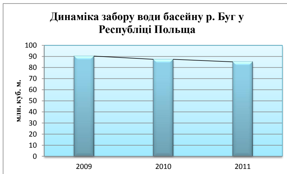
Рис.1. Динаміка забору води басейну р. Буг у Республіці Польща

Дані Головного управління статистики Польщі свідчать, що у загальному забір води басейну р. Буг у Республіці Польща має тенденцію до зниження. Так, у 2010 році показник зменшився на 2,9 млн. куб. м., тобто на 3,2 %, а у 2011 році у порівнянні з 2010р. – на 2,3 млн. куб. м., або на 2,6 % (Рис.1.).