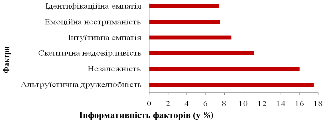
Рис. 1. Номінативно-інформативна факторна структура комунікативних характеристик медсестер поліклінік

Насамперед було встановлено факторну структуру комунікативних детермінант формування стратегій психологічного захисту медичних сестер, які працюють у поліклініках. Номінативно-інформативну факторну структуру комунікативних характеристик медсестер поліклінік представлено на рис. 1.