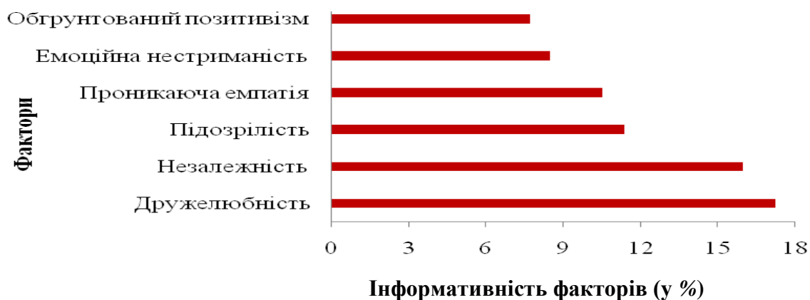
Рис. 3. Номінативно-інформативна факторна структура комунікативних характеристик медсестер інфекційних відділень лікарень

нант формування стратегій психологічного захисту медсестер інфекційних відділень лікарень представлено на рис. 3.