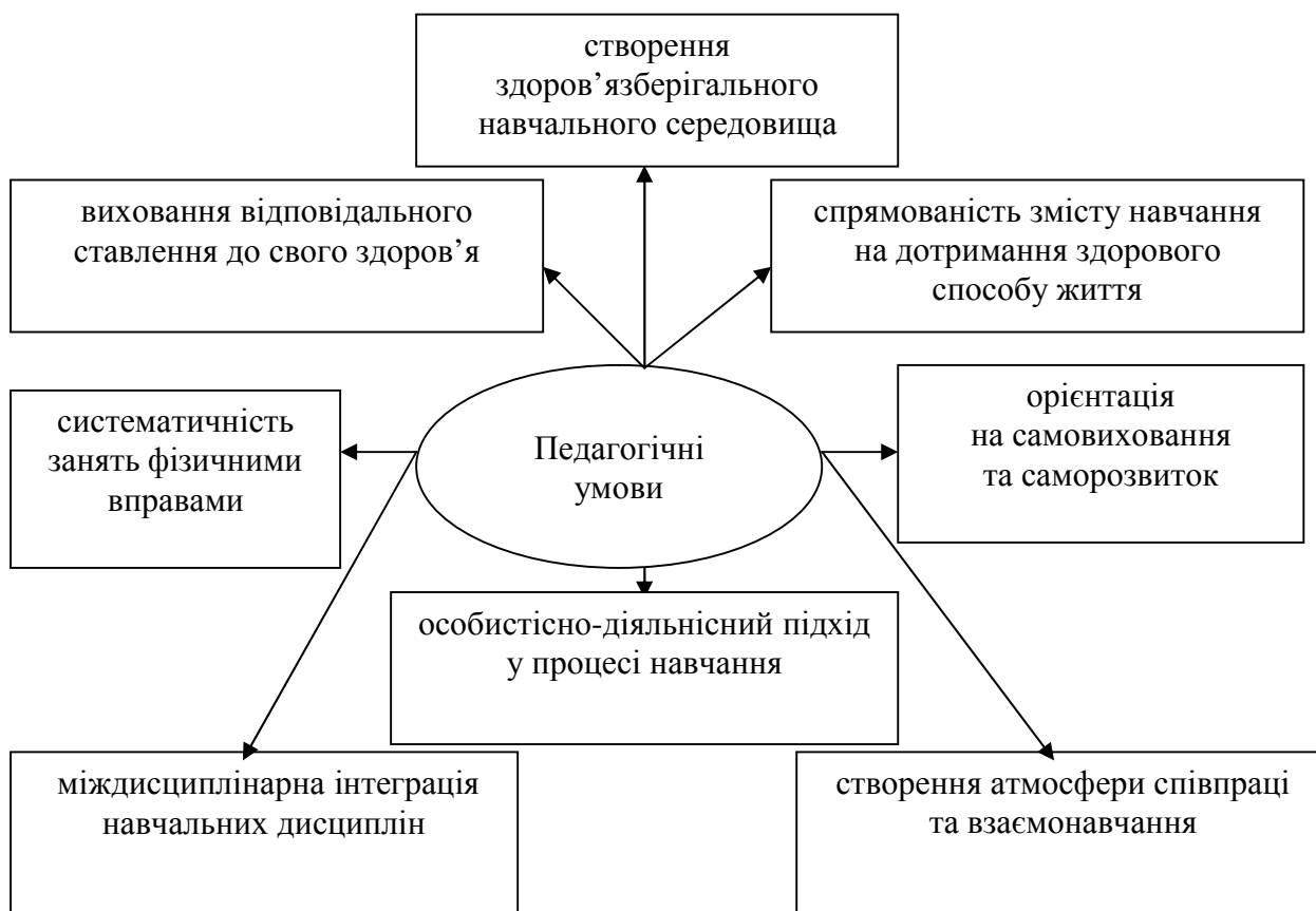
Рис. 2. Педагогічні умови формування здоров'язберігальних знань та навичок учнів дитячого притулку

Аналіз та узагальнення результатів дослідження дали змогу визначити основні педагогічні умови формування здоров'язберігальних знань та навичок молодших школярів дитячого притулку (рис. 2).