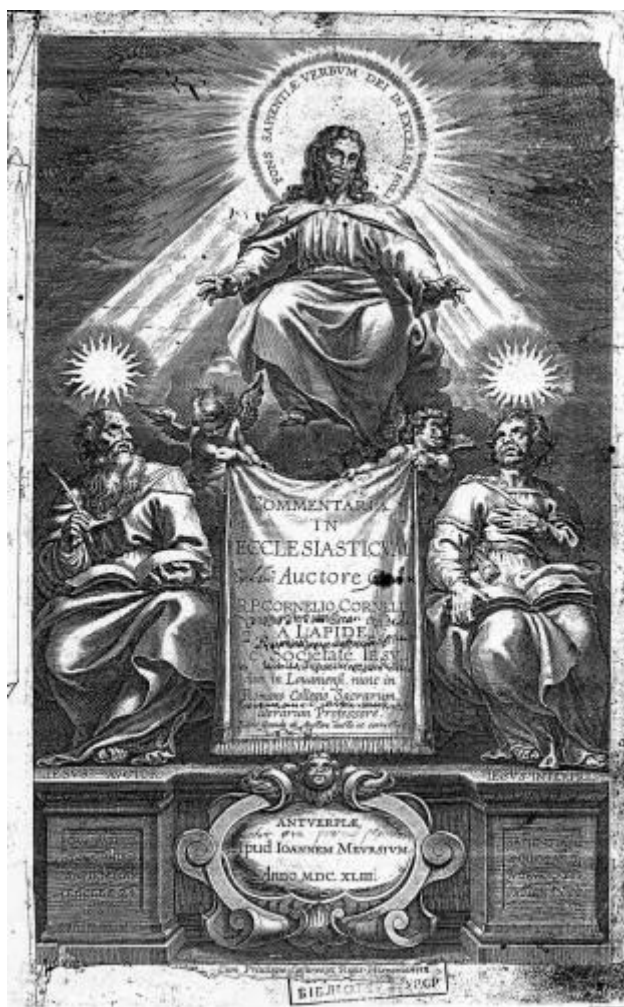
№1. Корнеліо Корнелі Гравер К.Галле