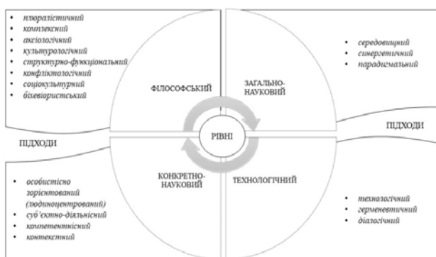
Рис. 2. Рівні та підходи методології дослідження проблеми формування критичного мислення громадян як чинника безпеки в умовах збройного насилля та інформаційної агресії

Прогнозування напрямів розвитку досліджуваної проблеми, перш за все, пов'язане з питаннями гарантування безпеки в умовах збройного насилля та інформаційної агресії та потребою у формуванні інноваційних підходів до державної політики в контексті формування критичного мислення різних категорій населення. Зокрема, є необхідність у перегляді безпекових концепцій, формуванні механізмів щодо гарантування безпеки громадян і територій, механізмів відновлення окремих інфраструктурних складових, постраждалих територій, країни в цілому як в умовах війни, так і повоєнного відновлення.