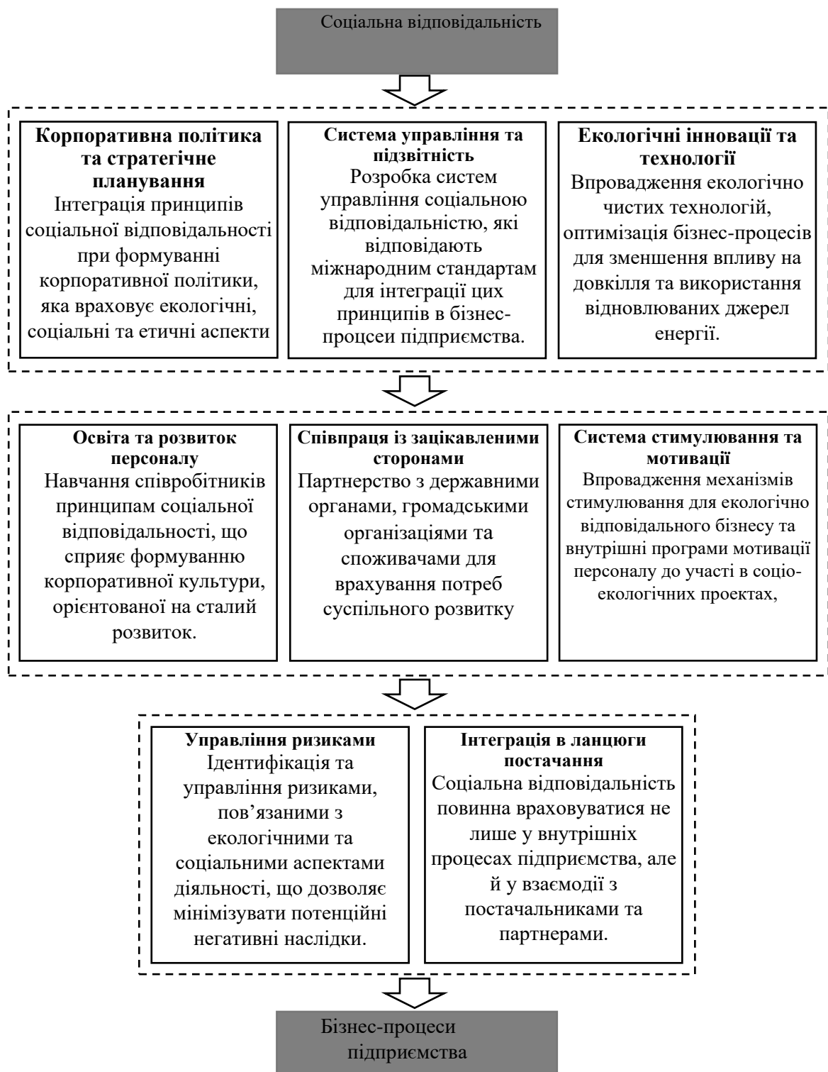
Рис. 1. Механізми інтеграції принципів соціальної відповідальності у бізнес-процеси

Крім того, соціально відповідальні стратегії сприяють зниженню ризиків, пов'язаних з екологічними та соціальними проблемами, через запровадження механізмів раціонального використання ресурсів і мінімізації негативного впливу на навколишнє середовище. Таким чином, вони формують основу для екологічно безпечної господарської діяльності та забезпечують стійкість бізнесу в умовах динамічних змін бізнес-середовища.