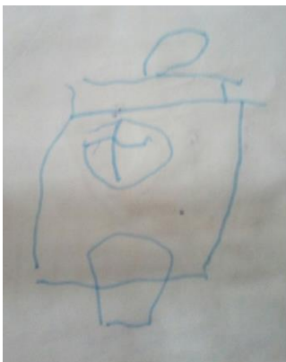
Рис. 2.2. Малюнок до завдання 2

Можемо спостерігати те, що дитина намагалася відобразити значення слів сумний і веселий. Для цього дитина зобразила два обличчя, одне з яких асоціюється зі значенням слова «сумний», а друге – «веселий».