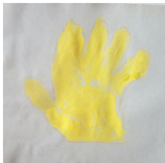
Рис. 2.6. Малюнок до завдання 9

Як бачимо, дитина зобразила слово з переносним значенням «золотий», зафарбувавши руки у відповідний колір.