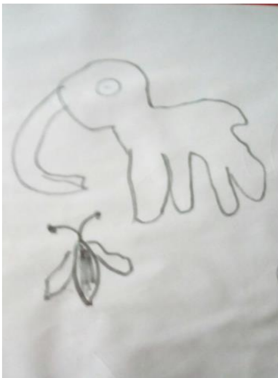
Рис. 2.3. Малюнок до завдання 3

На малюнку бачимо, як дитина тлумачить значення слова «великий». Дитина зобразила будинок практично на весь аркуш, показуючи у такий спосіб, що це великий будинок, тобто слово протилежне за значенням до малий.