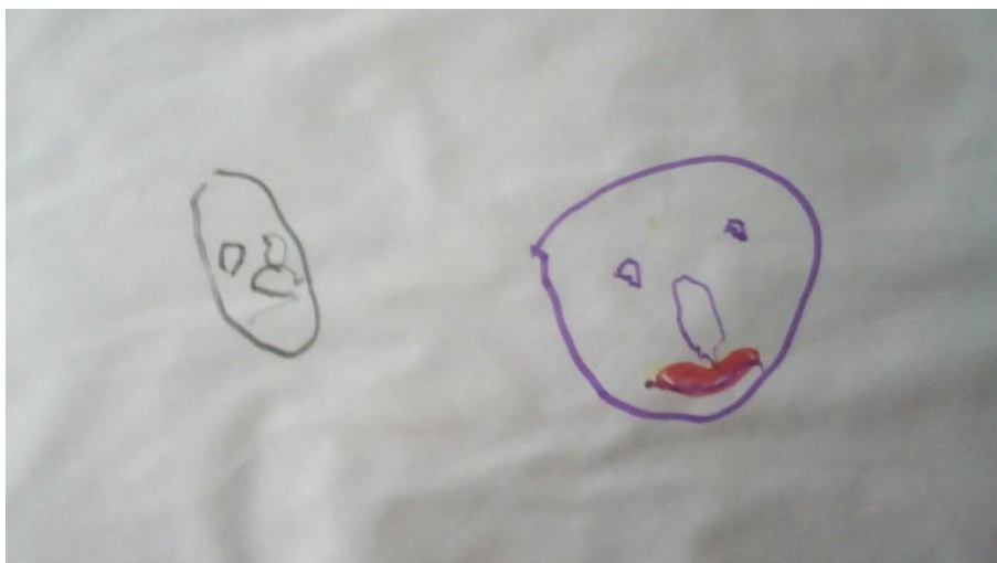
Рис. 2.1. Малюнок до завдання 1

Описані вище завдання використовувалися під час проведення формувального експерименту в експериментальній групі дошкільників 6-го року життя. Нижче пропонуємо декілька малюнків дітей, які виконували запропоновані їм завдання.