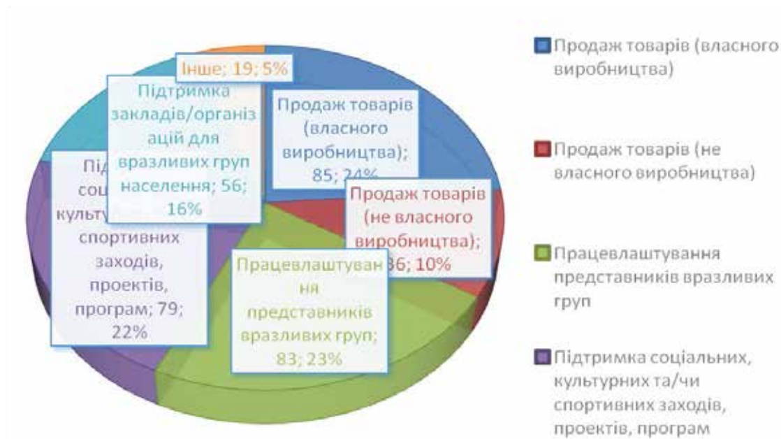
Рис. 2. Види діяльності соціальних підприємств в Україні