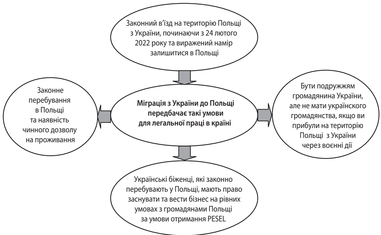
Рис. 1. Умови для легальної праці в Польщі