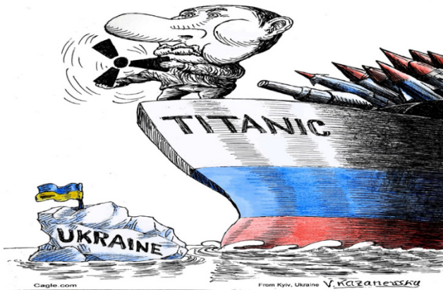
Рис. 4. ВІЙНА – це КАТАСТРОФА

На карикатурі (Рис. 4), що метафорично зображує російсько-українську війну як катастрофу «Титаніка», Росія уособлює «Титанік», символізуючи величезну імперію чи силу, яка переконана у своїй непереможності. Україну зображено як айсберг, невелика країна, яка знаходиться у конфлікті з великим супротивником. У зіткненні зі справжнім айсбергом «Титанік» зазнав катастрофи. Така метафорична проекція на цільовий домен може вказувати на трагічні та непередбачувані наслідки війни й для Росії.