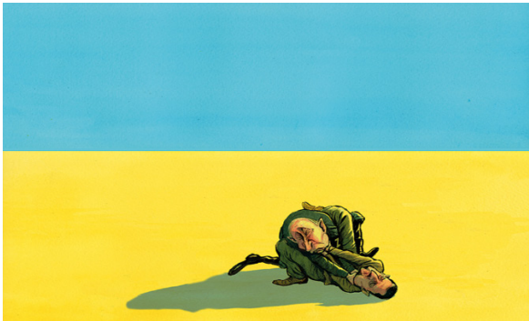
Рис. 1. ВІЙНА – це СПОРТ

сторони починають відчувати втому або втрату ресурсів. Зображення Зеленського, як учасника поєдинку, що притиснутий до землі, може свідчити про те, що сторони перебувають у нерівних умовах або постають перед труднощами у конфлікті. Проте фізичний вигляд президента України говорить про його рішучість і намір не здаватися, перемогти за будь-яку ціну, вираз його обличчя сповнений лютою ненавистю до суперника, водночас як вираз обличчя Путіна викликає глибоке відчуття антипатії.