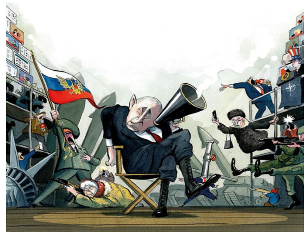
Рис. 3. ВІЙНА – це ТЕАТР

Карикатура (Рис. 3) зображає російсько-українську війну як театральну постановку, «головним режисером» якої є Путін, де все має відбуватися згідно з затвердженим сценарієм. Така метафора слугує засобом висловлення критики його дій, спробою висміяти абсурдність та парадоксальність війни, розв'язаною кривавим диктатором. Використання театральної метафори додає драматичності та емоційної інтенсивності до сприйняття конфлікту.