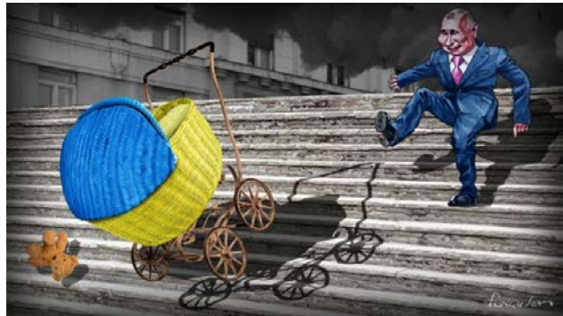
Рис. 5. ВІЙНА – це ЗЛОЧИН

відповідальність Путіна, як особу, яка ініціювала та веде війну, вказує на необхідність покарання винних у воєнних злочинах. У реципієнта такий візуальний образ викликає негативне сприйняття та осуд актів військової агресії.