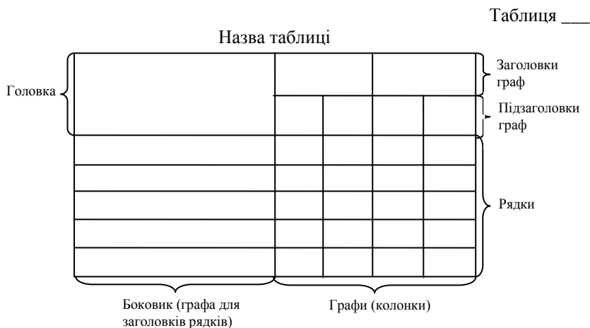
Рис. 3.1. Приклад побудови таблиці

Кожна таблиця повинна мати назву, яку розміщують над таблицею і друкують симетрично до тексту. Назву і слово «Таблиця» починають з великої літери. Назву не підкреслюють.