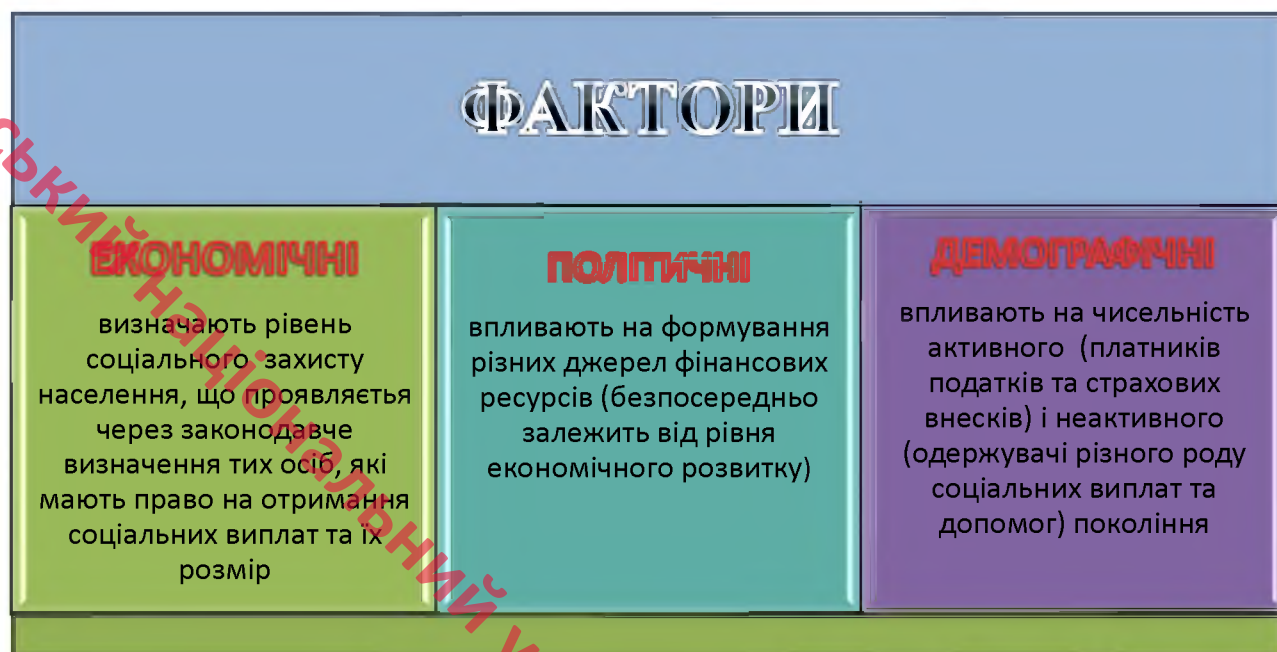
Рис. 1.2. Основні чинники, які впливають на потребу у фінансових ресурсах для соціального захисту населення

опосередкованого впливу, все-таки найбільший вплив на потребу у фінансових ресурсах має кількість та розмір соціальних трансфертів, які існують у системі соціального захисту.