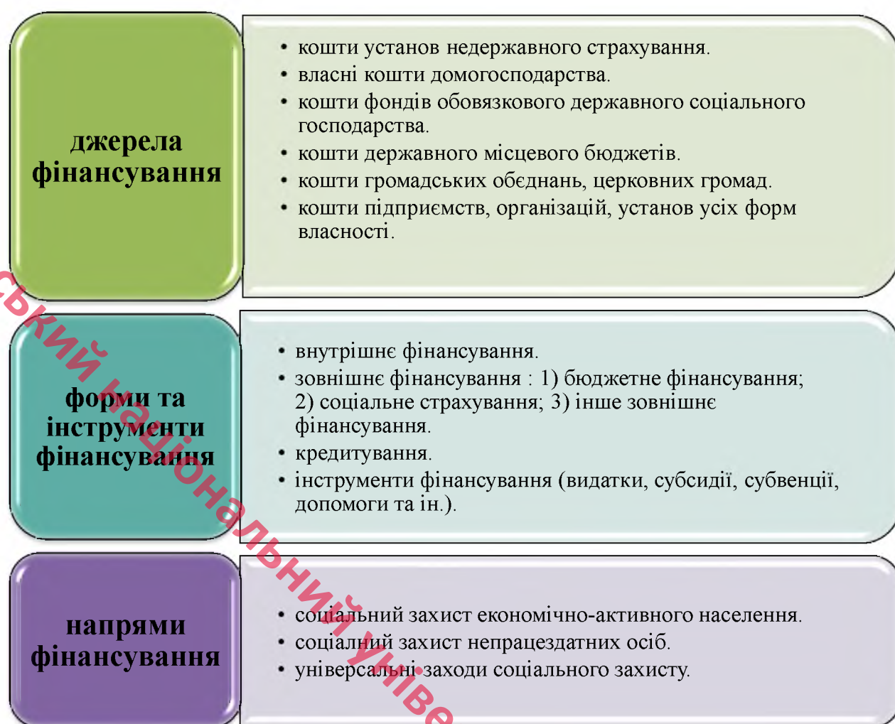
Рис. 1.1. Структурно-логічна схема фінансового механізму реалізації соціального захисту населення

Складник інформаційного забезпечення відіграє важливу роль у налагодженні взаємозв'язку між органами державної влади та місцевого самоврядування, державними та недержавними суб'єктами, що надають соціальні послуги, громадськістю. Інформаційне забезпечення значною мірою детермінує виконання важливих завдань державного управління у сфері соціального захисту, зокрема: моніторинг якості соціальних послуг та ефективність їх надання; контроль за цільовим використанням бюджетних коштів, дотриманням і виконанням державних соціальних стандартів, ліцензійних умов; аналіз екзогенних і ендогенних факторів, які впливають на надання соціальних послуг, прогнозування їхніх обсягів; розроблення та