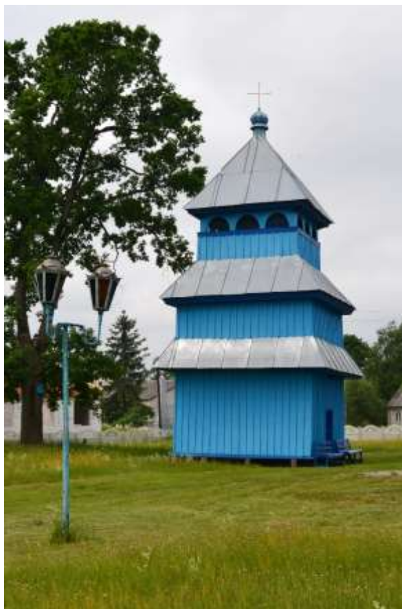
Рис. 2. Дзвіниця церкви Різдва с.Троянівка [5]

Можемо відмітити домінування пам'яток історії культури та монументального мистецтва (44 %) серед усієї історико-культурної спадщини. Об'єкти спадщини розташовані у переважній більшості сіл громади. Значна їх частина включена в туристично-рекреаційні маршрути громади, району, проте не всі.