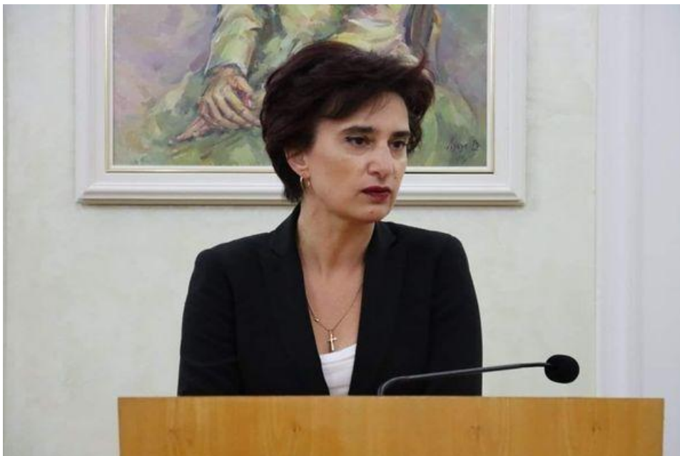
Під час виступу