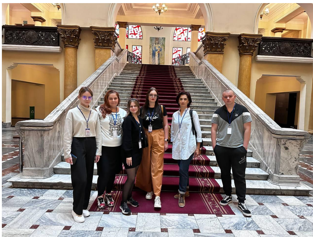
Візит до Парламенту Грузії, 2023