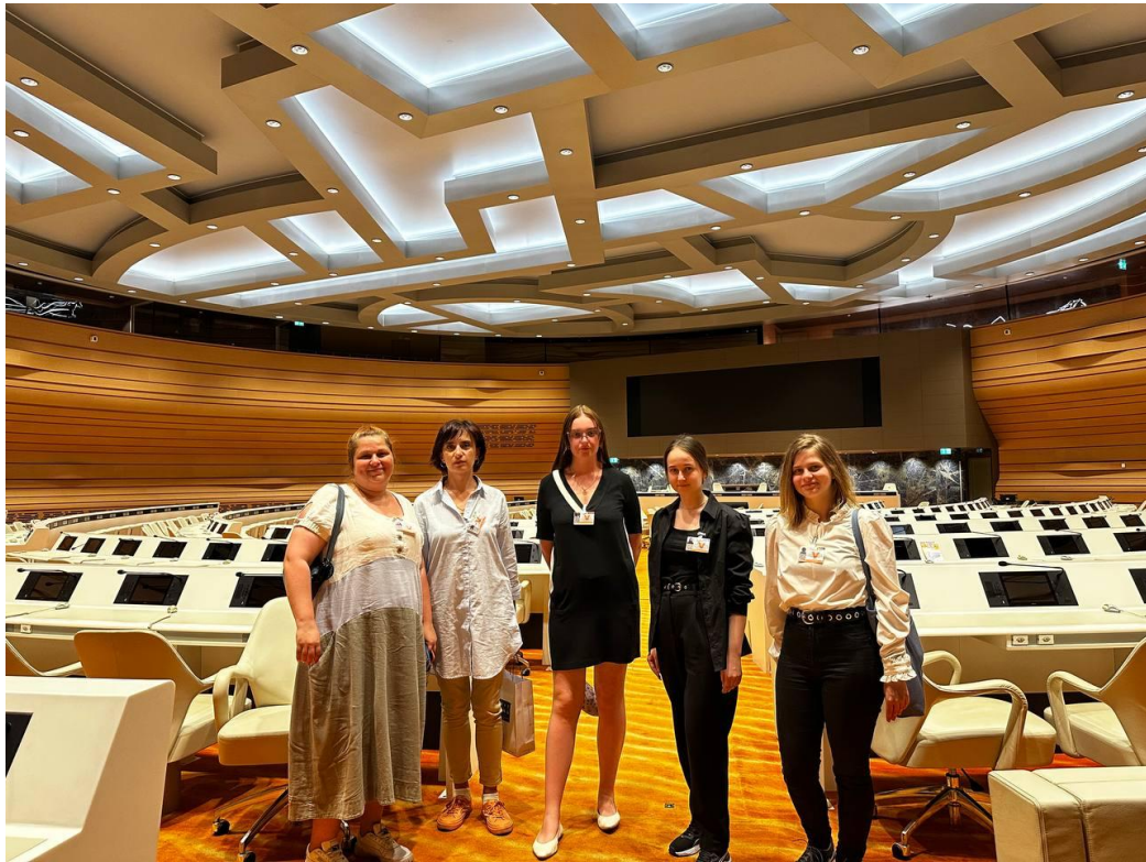
Візит до європейського офісу ООН, Женева, 2023