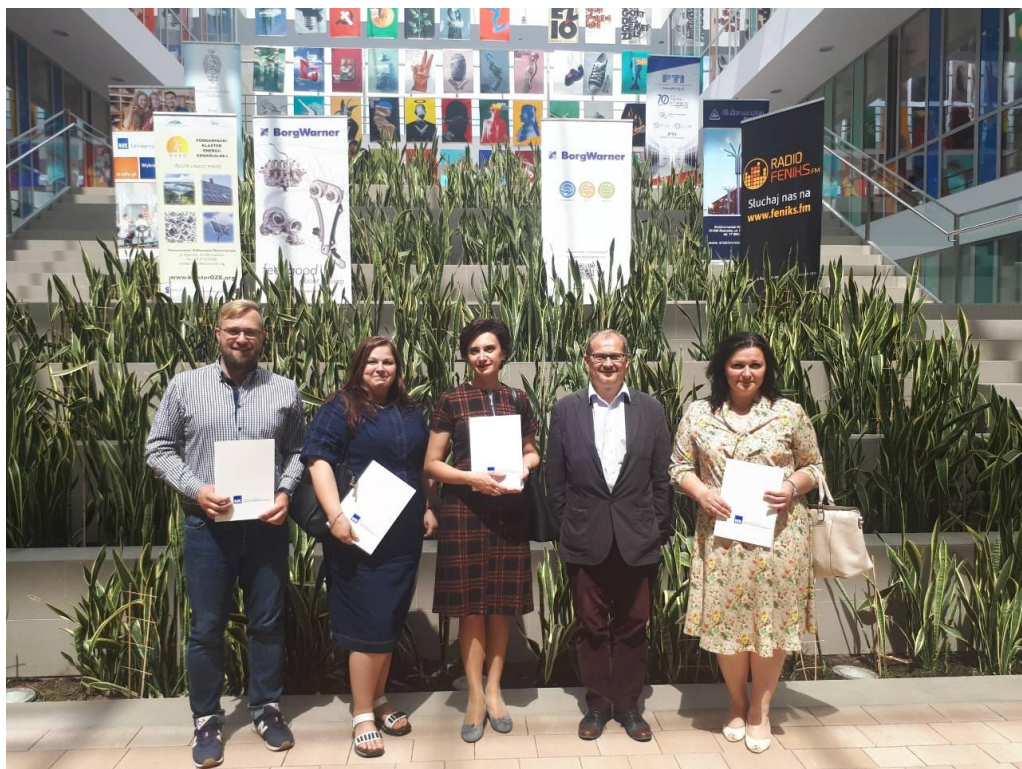
Стажування в Департаменті міжнародних відносин Інституту політичних наук, соціологічно-історичного факультету Жешувського університету, Республіка Польща, 2018