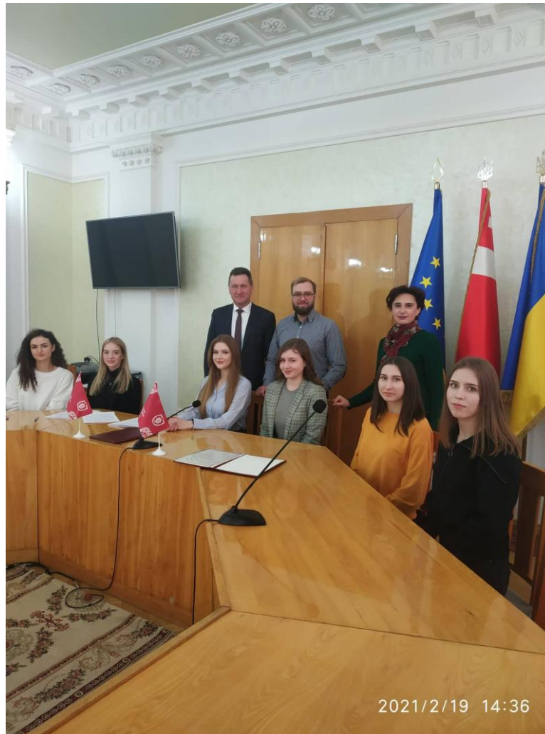
Підписання Договору про дуальну освіту, 2021