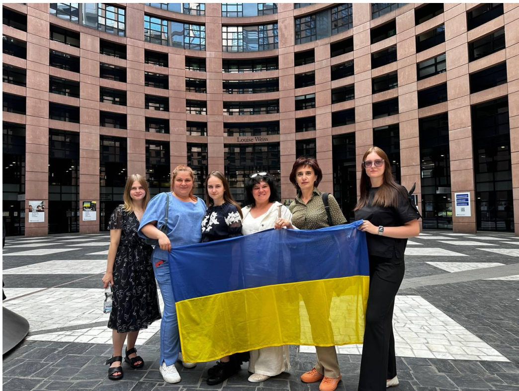
Візит до Європейського парламенту, Страсбург, 2023