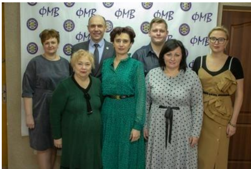
Кафедра міжнародних комунікацій та політичного аналізу, 2021