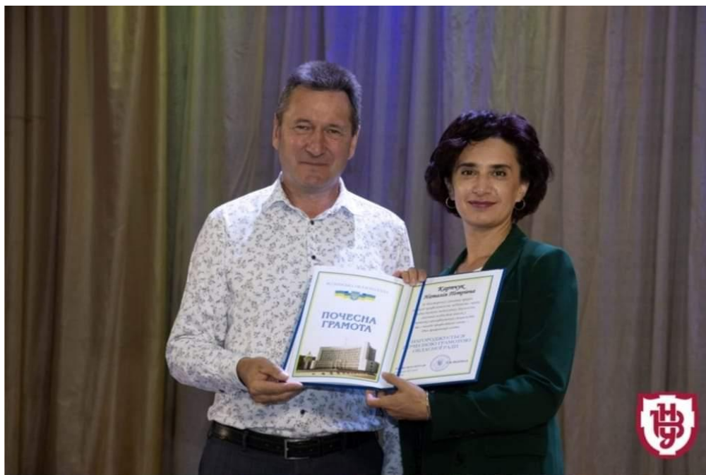
Вручення Почесної грамоти Волинської обласної ради, 2023