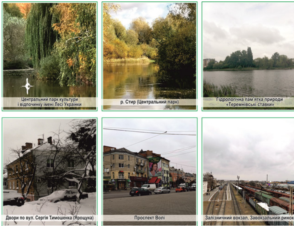
Рис. 2. Зони прохолоди (фото 1–3), перехідні зони (фото 4), теплові смуги (фото 5), «острови тепла» (фото 6) (зображення авторські)

Мікрокліматичні зони певною мірою збігаються з ділянками міста, що є елементами його планувальної структури. До них відносять житлові мікрорайони та іншу міську забудову, територію промислових підприємств, майдани та вулиці, транспортну мережу, лінії прокладання комунікацій, кладовища та меморіали, водні потоки та замкнуті водойми, масиви зелених насаджень (парки та сквери), санітарно-захисні зони підприємств. Ці ділянки в місті виділені залежно від особливостей їх призначення та використання. Відповідно до правил містобудування, планування й забудови міських територій вказані ділянки є складовими частинами функціональних зон міста, а саме: поселенської, виробничої промислової, транспортної, ландшафтно-рекреаційної (табл. 4).