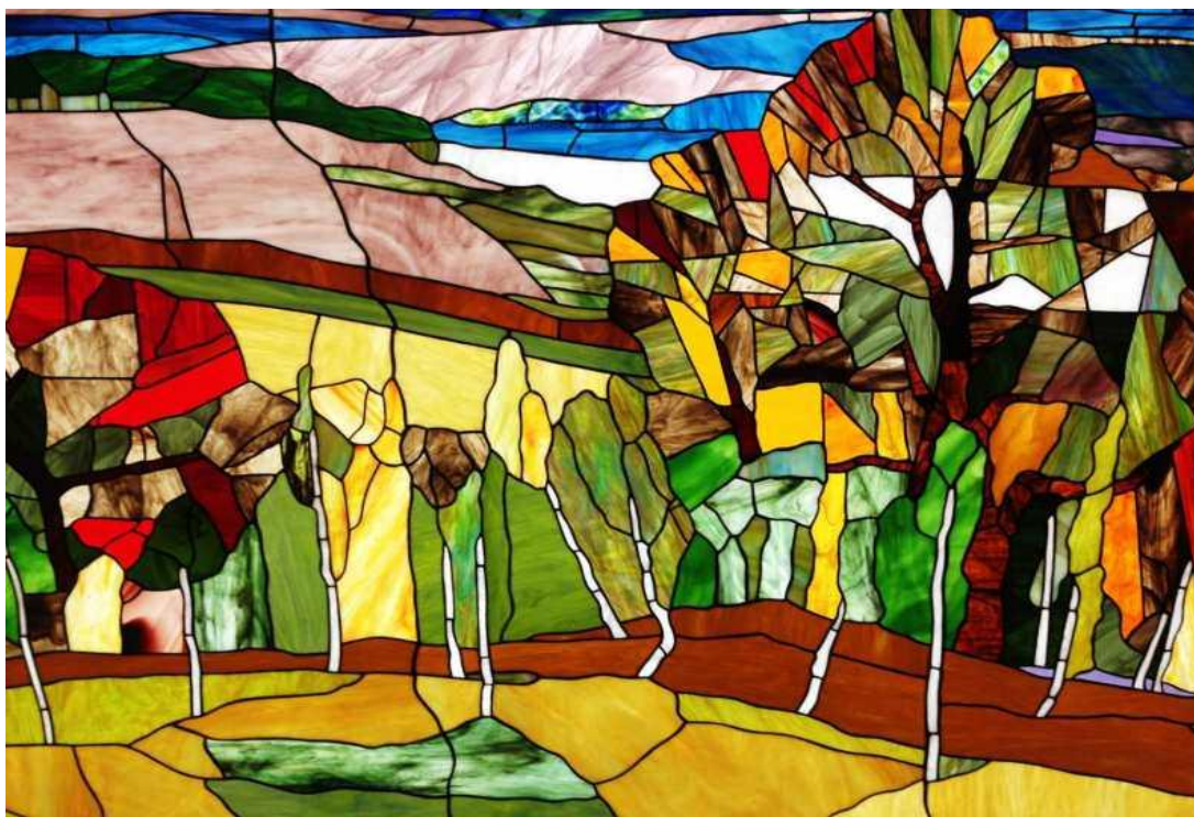
Розписний вітраж. «Осінній пейзаж».