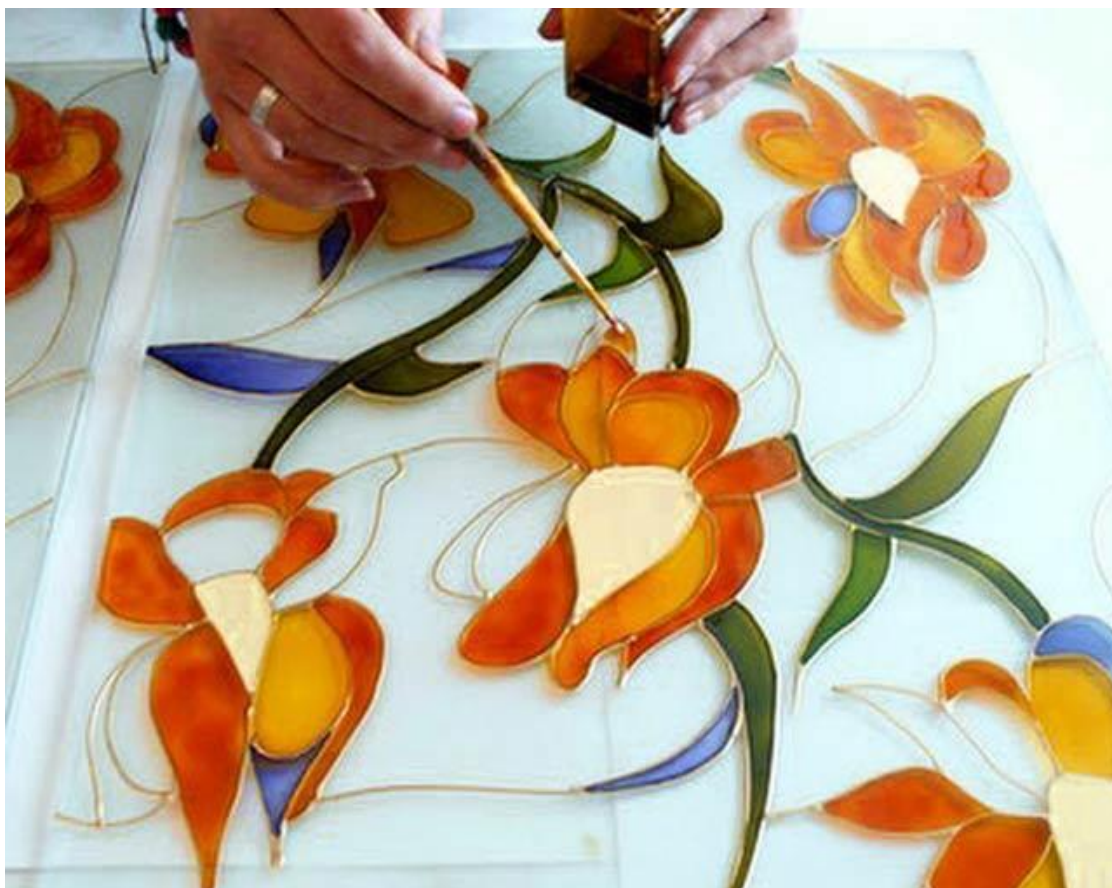
Мал. 2. Заливка комірок розписного вітражу.

Якщо фарба здається занадто густою, не поспішайте розріджувати її розчинником. Від цього втрачається ясність і прозорість фарби. Спробуйте додати трохи безбарвної фарби. Якщо мало допомогло, то фарба може бути несвіжою. Подивіться на термін придатності.