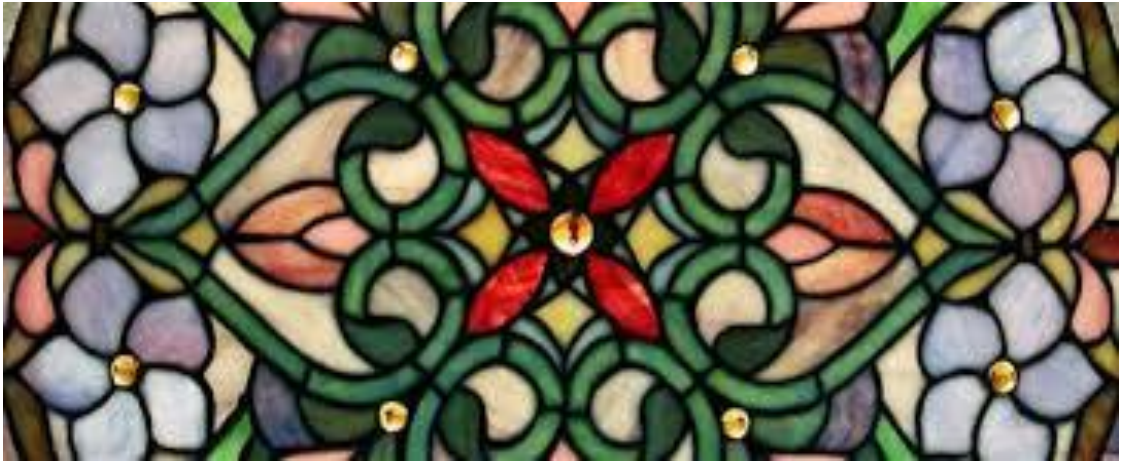
Візерунок в техніці розписного вітражу.