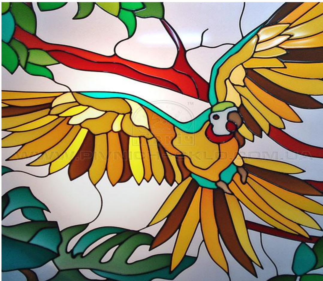
Розписний вітраж. «Птаха».