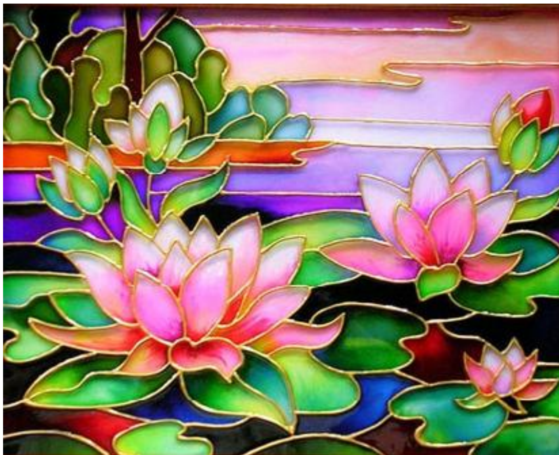
Розписний вітраж. «Латаття».