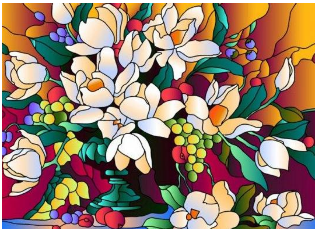
Розпис по склу. «Магнолії».