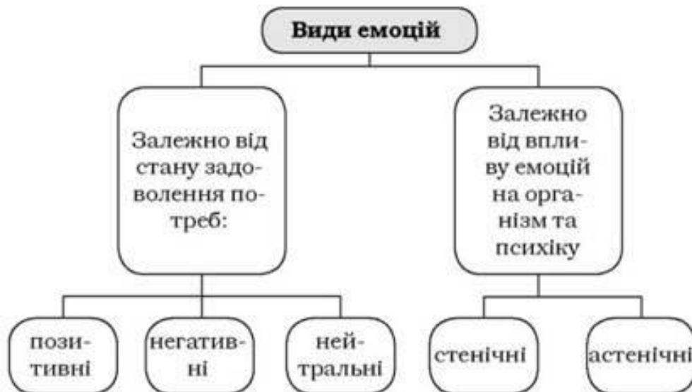
Рис. 2. Класифікація емоцій людини