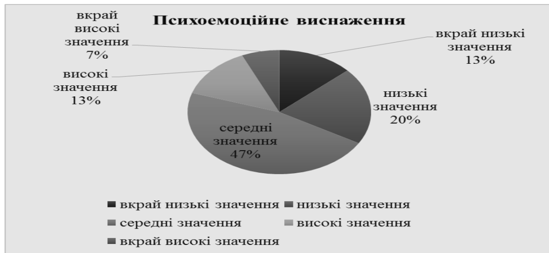
Рис. 3. Відсотковий розподіл показників за шкалою «Психоемоційне виснаження» (за методика Рукавішнікова)

Висновки і перспективи подальших розвідок. Проаналізовано особливості впливу емоційного вигорання на особистість студентів технічного університету. Доведено, що поняття емоційне вигорання студентів постає як низка взаємопов'язаних чинників, які визначають діяльність особистості. Здійснено емпіричне дослідження сформованості фаз і стадій синдрому емоційного вигорання серед студентської молоді. Результати емпіричного дослідження виявили, що у студентів технічного університету не виявлено повністю сформованих симптомів емоційного вигорання та є проблеми з мотиваційною сферою професійного розвитку. Результати дослідження відображають лише окремих аспект впливу отримання академічних знань на емоційне виснаження студентської молоді і висвітлюють лише частину наявної проблеми, яка, безумовно, заслуговує на подальше дослідження. Зокрема, нами планується детальне дослідження різних компонентів, що можуть спричинити формування синдрому емоційного вигорання та їх взаємодію з умовами отримання академічних знань.