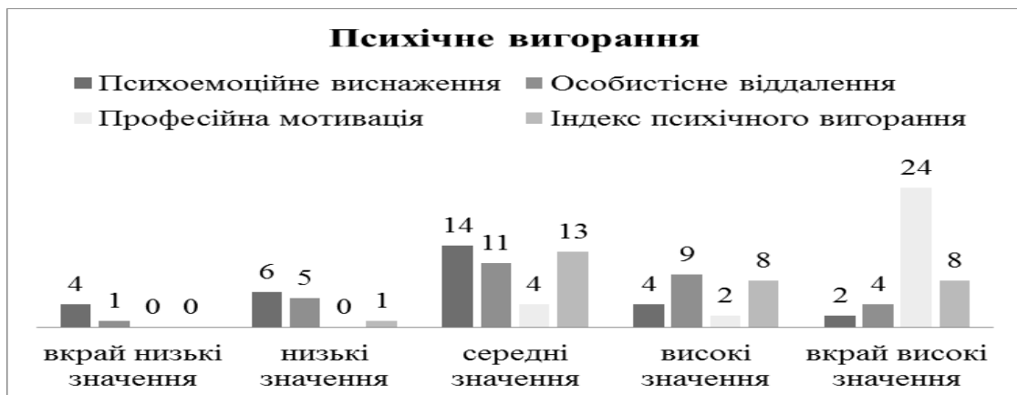
Рис. 2. Числовий розподіл показників рівнів психічного вигорання студентської молоді (за методикою Рукавішнікова)

Після проведення методики «Визначення психічного вигорання» Рукавішнікова реципієнти, які брали участь у дослідженні були розподілені за кількістю отриманих балів у числовому відношенні (рис. 2.).