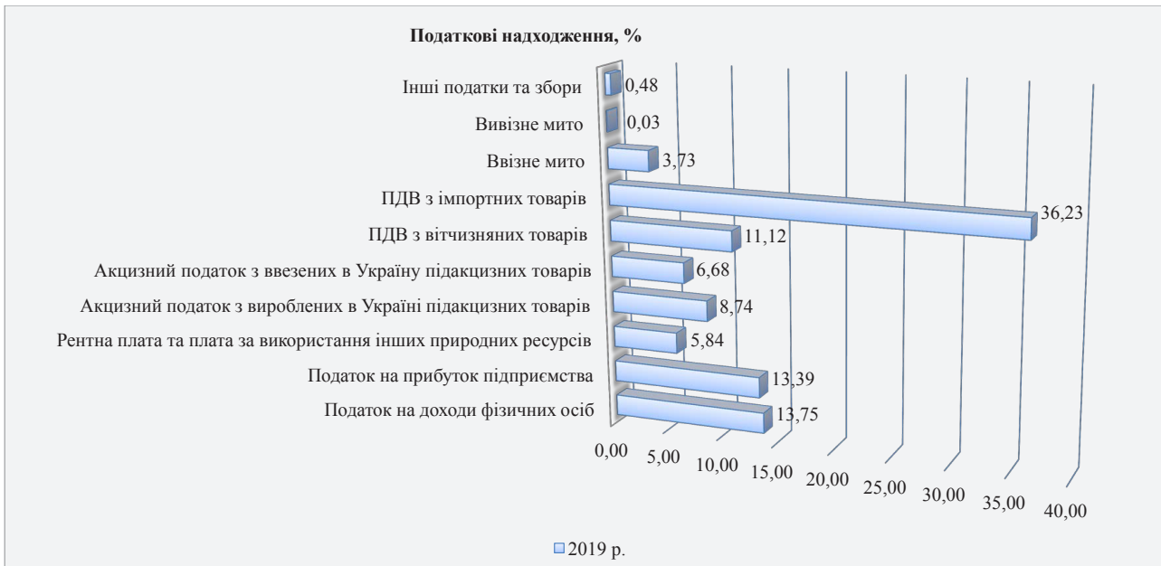
Рис. 1. Податкові надходження до бюджету у 2019 р.