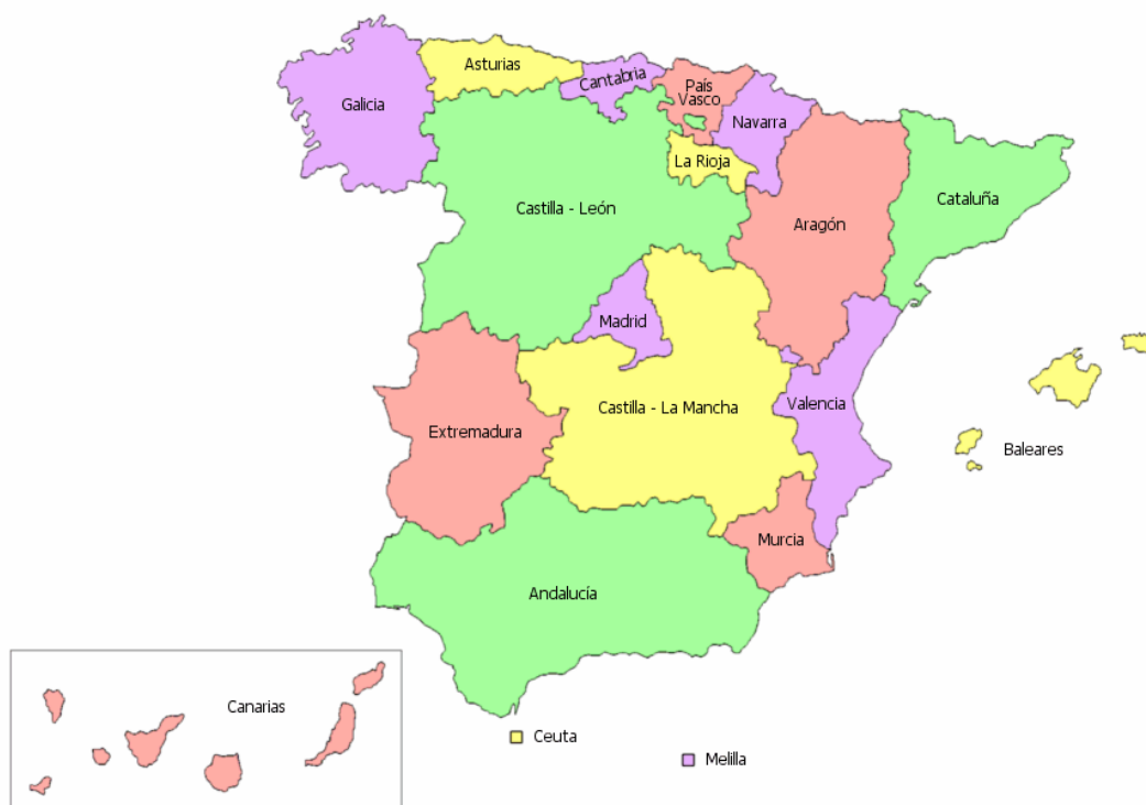
Рис. 1. Автономні спільноти Іспанії [1]

утворень – провінцій, а також низових одиниць – муніципалітетів. Кожен елемент адміністративно-територіальної системи країни наділений певними правами правової автономії. Найбільші юридичні та фінансово-господарчі компетенції у цій державі закріплені за провінціям, які мають спільні кордони, історичні, культурні та економічні особливості утворювати автономні спільноти. Останні функціонують згідно власних статутів. Вони мають автономний парламент та уряд, а також наділені правами вирішення місцевих завдань та приймають ключові управлінські рішення для територіальної спільноти, які часто відстоюють етнонаціональні інтереси регіону [8]. Територія країни поділена на 50 провінцій, три з яких є острівними провінціями: Балеарські острови, Лас Пальмас, Тенерифе. При цьому статус провінцій, як і автономних спільнот, є асиметричним, що складається з трьох видів: 1) острівні території; 2) Баскські «історичні території»; 3) однопровінційні автономні спільноти (Астурія, Кантабрія, Наварра, Ла Ріоха, Мадрид, Мурсія). Останні є одночасно адміністративно-територіальними одиницями вищого й середнього рівнів – провінціями та автономними спільнотами.