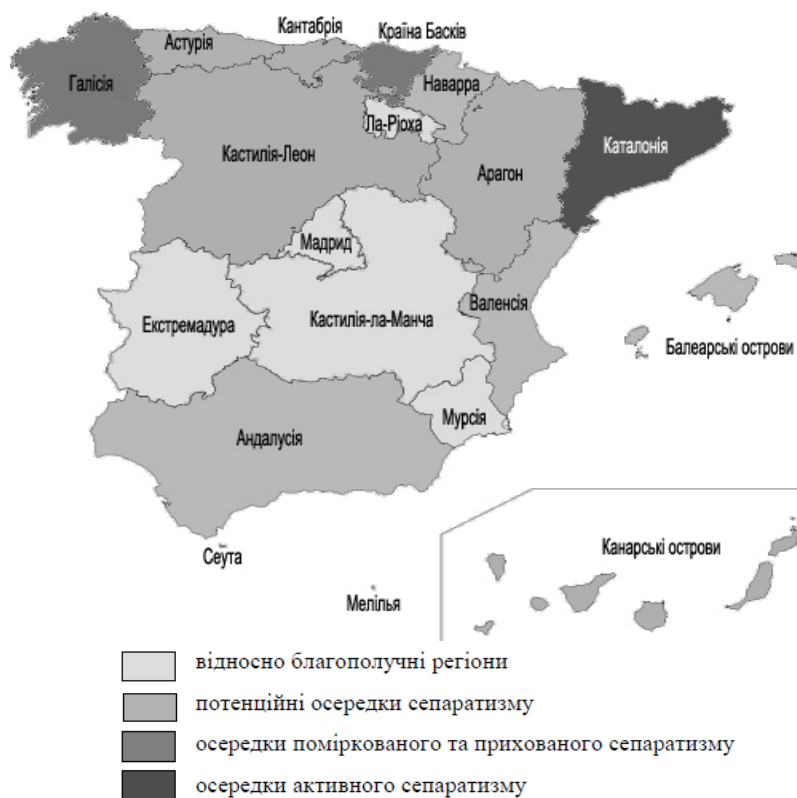
Рис. 3. Інтенсивність проявів сепаратизму в автономних спільнотах Іспанії

(В. Ріна, І. Філоненко, Ю. Філоненко, 2018 р.) [14]