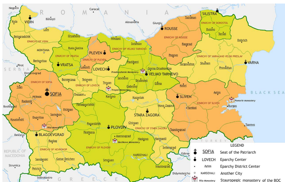
Рис. 1. Розміщення епархій Болгарської Православної Церкви [7]