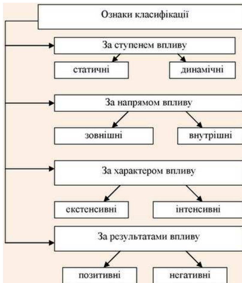
Рис. 2. Класифікація факторів розвитку туризму [17]

соціального розвитку території, функціонування фінансової системи країни, купівельна спроможність населення та рівень його життя, динаміка населення і якісні характеристики трудових ресурсів тощо) [14]. Так, науковці О. Азарян та Н. Жукова визначають, що для розвитку туристичної індустрії в будь-якій країні, у тому числі й Україні, наявні обмежувальні фактори, які потрібно постійно долати й нівелювати ними з метою налагодження успішного туристичного сервісу в державі [1]. До останніх вони відносять негативні явища в економіці та політиці країн (наприклад конфлікти), а також гнучко-динамічні фінансово-економічні й ринково-споживчі процеси.