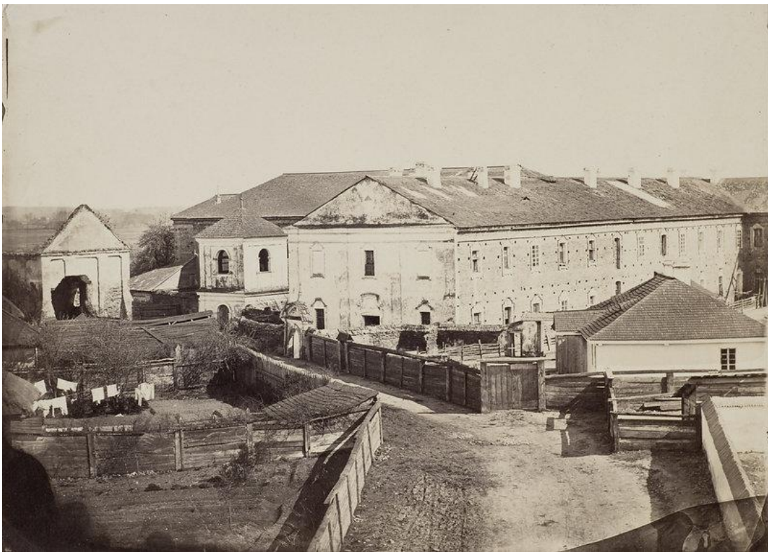
Вид Луцької окружної (повітової) тюрми в середині 1890-х років.

На початок 1879 року в Луцькій повітовій тюрмі залишалось в ув'язненні – 46 осіб, протягом 1879 року прибуло – 234 арештанти, вибуло – 184, залишилось в ув'язненні на початок 1880 року – 96 осіб. В загальній кількості арештантів нараховувалось: 6 неповнолітніх та 1 політичний в'язень [226, арк. 55].