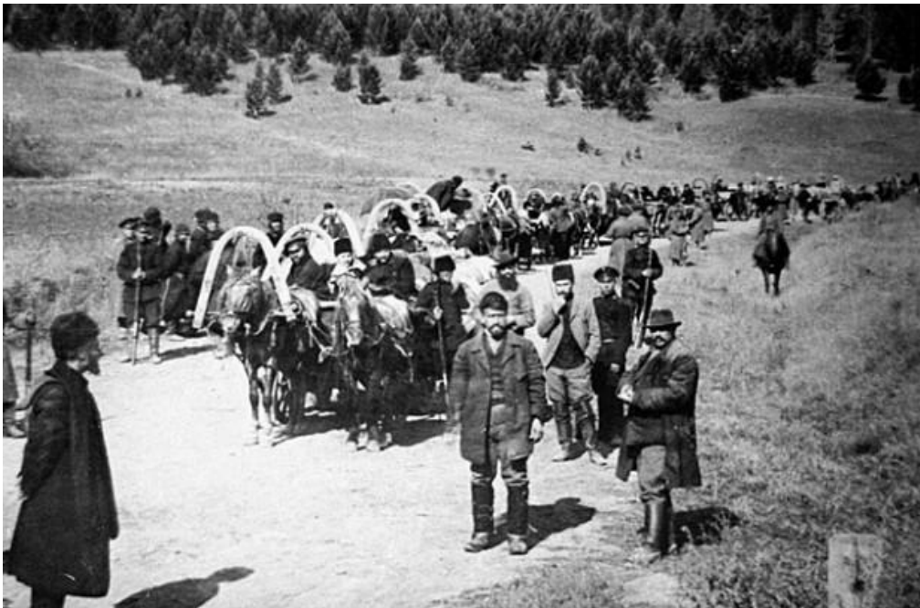
Етап засланих по дорозі до Сибіру. Фото 1902 року

Таким чином, в історії Російської імперії була вперше запроваджена єдина система етапування арештантів на величезні відстані, а сам термін «етап» (від французького «етаре» – перегін, перехід) знайшов своє законодавче визначення.