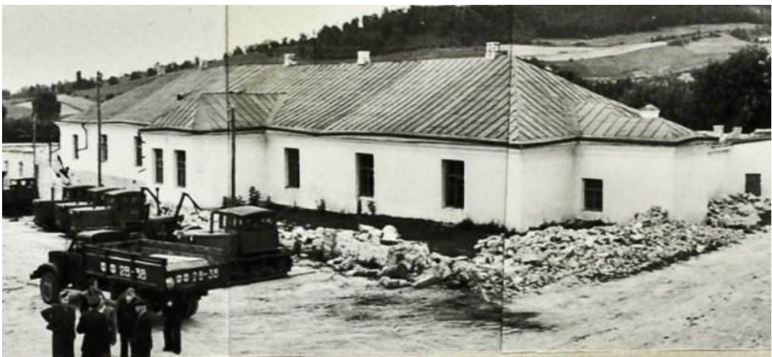
Вид колишньої Кременецької повітової тюрми в 40-х роках ХХ ст.

На розвиток Кременецької тюрми у 1879 році внесено приватних пожертвувань в сумі 38 рублів 11 копійок.