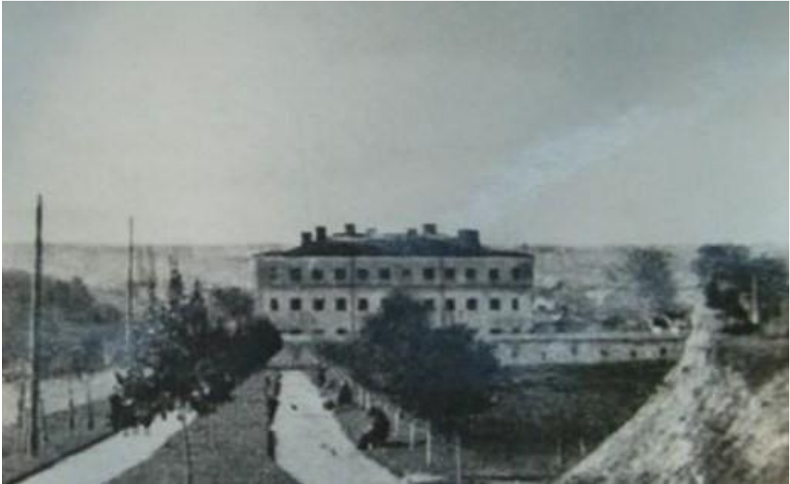
Вид Рівненської повітової тюрми в 30-х роках ХХ ст.

На розвиток Рівненської тюрми у 1879 році внесено приватних пожертвувань на суму 23 рублі 95 копійок. Це перший випадок, коли у звіті губернатор зазначає про наявність приватних пожертвувань на розвиток в'язниці.