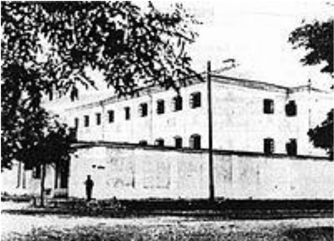
Вид Ковельської повітової тюрми в 30-х роках ХХ ст.

На початок 1879 року в Ковельській повітовій тюрмі залишалась в ув'язненні – 71 особа, прибуло протягом 1879 року – 484 арештанти, вибуло – 453, залишилось в ув'язненні на початок 1880 року – 102 особи. В загальній кількості арештантів нараховувалось: 7 неповнолітніх та 2 політичних в'язні [226, арк. 56].