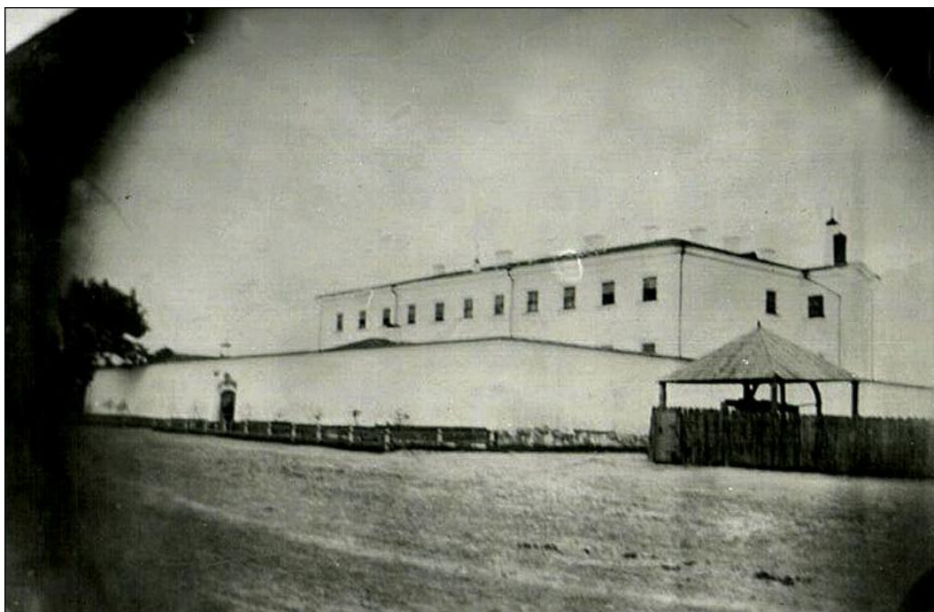
Вид Овруцької повітової тюрми наприкінці XIX – початку XX ст.

Острозька повітова тюрма розташовувалась в центрі міста, в орендованому приміщенні за 1050 рублів на рік.