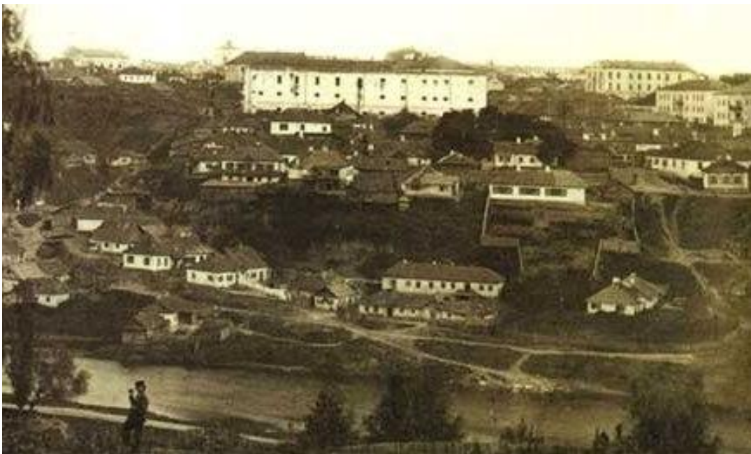
В центрі знімку келії колишнього Єзуїтського монастиря, які після 1871 року облаштували під тюремні приміщення. Фото 1873 року, автор А.Зелінський.

Станом на 1804 рік більша половина тюремних установ Волинської губернії розташовувалась у будівлях, які уже на той час визнавались такими, що за своїми інженерно-технічними характеристиками не відповідали функціональному призначенню, адже у них було неможливо утримувати арештантів порізно (в залежності від виду вчинених злочинів). Особливо критична ситуація склалась у містах Дубно, Луцьку та Радзивиліві, де тюремні будівлі знаходились у вкрай небезпечному стані. Зокрема, в Радзивиліві тюрма розташовувалась у будівлі, яка майже повністю осіла в землю. Найкращими умовами утримання арештантів вирізнялась тоді тільки Житомирська губернська тюрма [222, арк. 95-97].