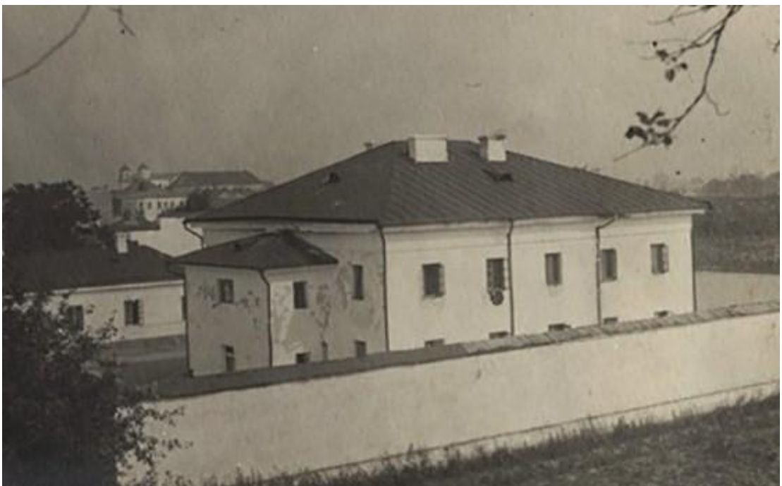
Вид Володимир-Волинської повітової тюрми в 20-х роках ХХ ст.

Сума приватних пожертвувань на потреби Володимир-Волинської тюрми у 1879 році склала 10 рублів [226, арк. 55-56].