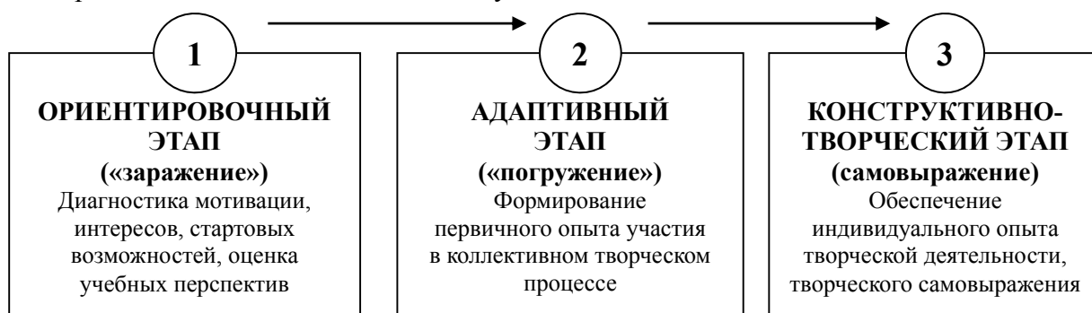
Рисунок 3. – Этапы реализации педагогической технологии формирования творческой направленности старшего дошкольника во внешкольном учебном учреждении

Представленный на рисунке 3 ориентировочный этап соответствует моменту знакомства ребёнка с педагогом и самим внешкольным учебным учреждением. Приход на занятия большинства воспитанников в возрасте 5-ти лет реально обусловлен выбором родителей (87%), значительно реже советом педагогов дошкольного учебного заведения (7%). Обычной также практикой (82%) является подготовительная беседа, неоднократно проводимая родителями с ребёнком о том, «как интересно в Доме школьников», с целью минимизировать возможный сценарий отказа от занятий. Этому способствует опыт, полученный большинством родителей на этапе адаптации ребёнка к посещению детского сада. Таким образом, можно сделать вывод о том, что пропедевтическая работа по подготовке ребёнка к первому визиту во внешкольное учебное заведение проводится относительно благополучно.