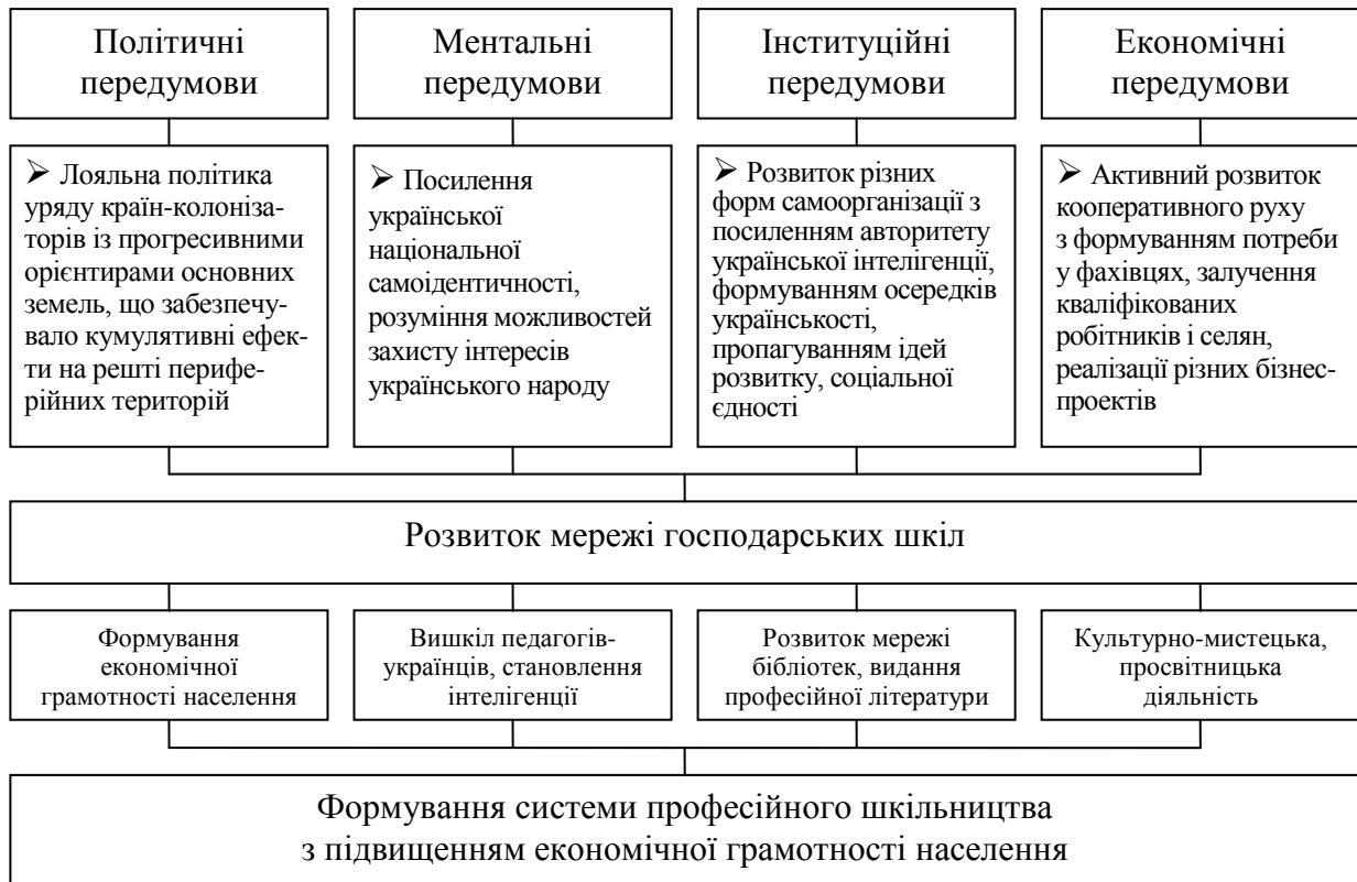
Рис. 4. Передумови та результати створення мережі господарських шкіл

Розкрито передумови та результати створення мережі господарських шкіл на західноукраїнських землях кінця XIX – першої половини XX століття (рис. 4) й обґрунтовано їх значення в поширенні економічних знань і формуванні економіки ринкового типу.