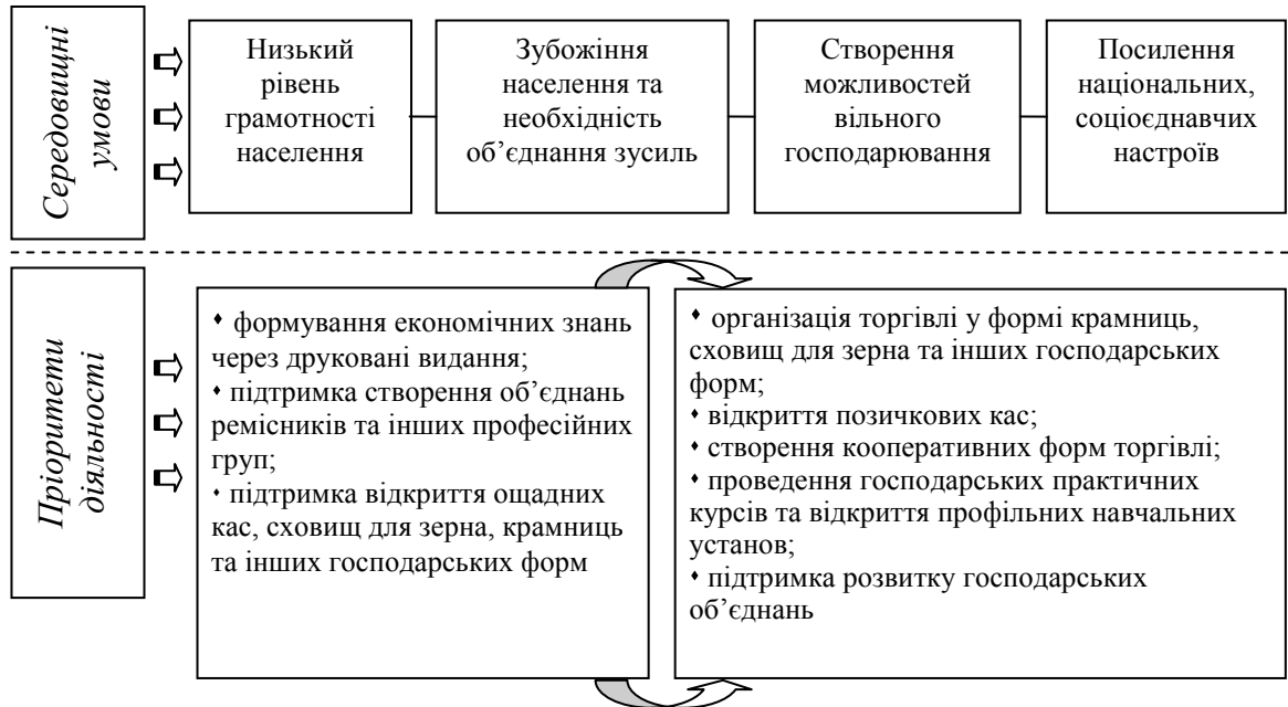
Рис. 2. Характерні риси розвитку економічних знань на західноукраїнських землях

Визначено характерні риси розвитку економічних знань на західно-українських землях у другій половині XIX – першій половині XX століття (рис. 2).