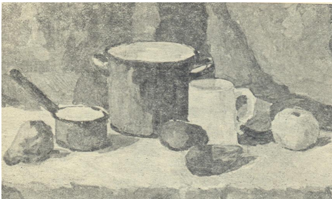
Рис 3. Навчальний натюрморт. Темпера.

Мазок в темперному живопису не повинен бути самоціллю. Навчальна робота в цій техніці вимагає у живописця кропіткої та уважної праці, дозволяє навчитися швидко і широко розкрити в кольорі великі частини майбутнього твору, лаконічно передавати тіньові і освітлені місця предметів, великі маси складок драперії, узагальнено вирішувати тло. Вивчення живопису темперою потрібно проводити на прикладах нескладних натюрмортів з введенням в них більш складних за формою і кольором предметів.