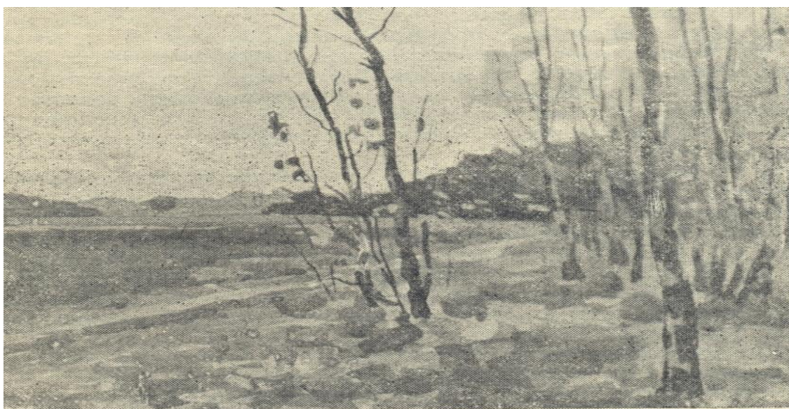
Рис. 2. Етюд пейзажу. Гуаш.

Важливу роль в гуашевому живопису відіграють білила. Надмірне їх використання робить колір білесуватим. Під час виконання живопису виникають певні труднощі. Вони полягають в тому, що після висихання фарби сильно світліють і потрібний чималий досвід, щоб передбачити потрібний тон. В гуаші більше ніж в акварелі проявляється силуетність нанесених на площину проміжних кольорових плям, різкість мазка. Через це в даній техніці важче ліпити форму, віднайти м'якість переходу одного тону в інший. Прийом лесування в гуаші майже не застосовується. Пастозним властивостям техніки, більше відповідає живопис, побудований на декоративності кольорового рішення, силуетності тональних мас зображення. В роботі над навчальними постановками рекомендується писати мазком створюючи гру кольорових плям при виявленні форми предметів. При цьому в живопису необхідно виконати різні прийоми. Цей вибір залежить від характеру форми предметів, контрастності кольорів і структури поверхні. Тонкошарові покриття можна поєднувати з пастозними, широкий мазок в зображенні великих мас з дрібними мазками формуючими потрібну деталь.