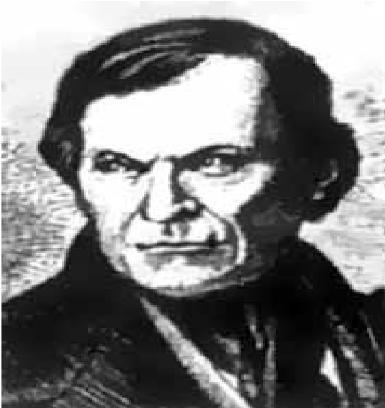
Іван Вагилевич (1811-1866рр.)