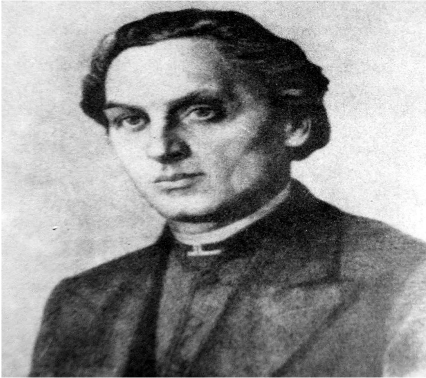
Маркіян Шашкевич (1811-1843)