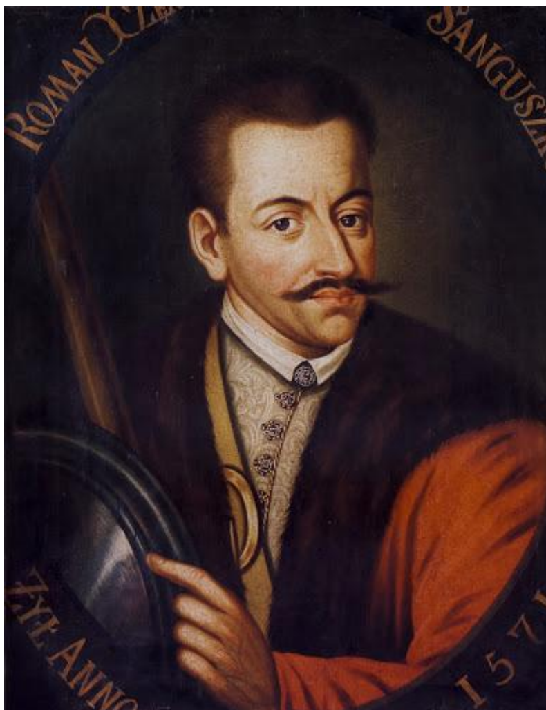
Рис. 2. Портрет Романа Сангушко. Автор К. Александрович (XVIII ст.).

Через трагічну смерть старшого брата Дмитра, Роману в молодому віці прийшлося очолити рід Сангушків, ця подія сталася, коли йому за ледве виповнилось сімнадцять років. Труднощі й нові обов'язки Романа не злякали. В 1555 р. він пішов на військову службу до королівського війська, де через два роки, у 1557 р. отримав універсал від короля Сигізмунда II Августа на староство у м. Житомир. Приїхавши у свої нові володіння, новий господар починає активно укріплювати фортецю і організовує в регіоні низку вдалих захисних кампаній проти кримських татар.