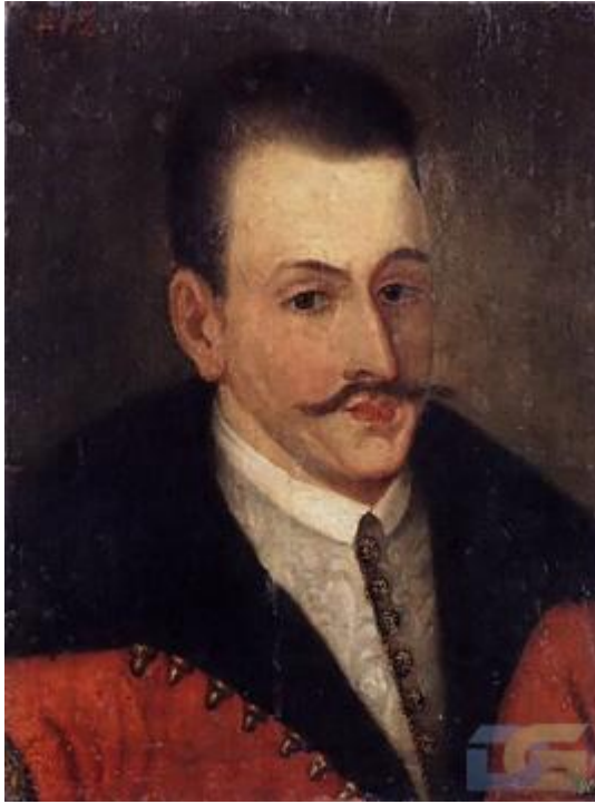
Рис. 3. Портрет Романа Сангушко. (XVI–XVII ст.).