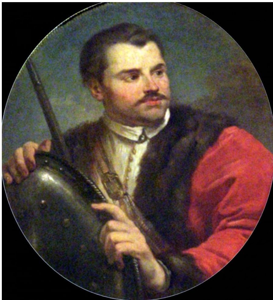
Рис. 1. Портрет Романа Сангушко в Королівському замку в Варшаві. Марчелло Баччареллі

вузького кола «головних княжат», які входили до складу Великої ради Русько-Литовської держави [3, 87].