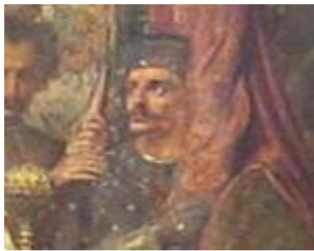
Рис. 5. Роман Сангушко на картині «Люблінська унія».

тверезий і військовій справі добре досвідчений». Його військові успіхи були результатом застосування ним тактики нерегулярної війни, раптових ударів по противнику малими силами і добре організованої розвідки. В XVI ст. Сангушки утримували власні війська, які складались із професійних дружин та ополчення васалів, це засвідчувало про високий рівень підготовки і обороноздатності [9, 187]. У грудні 1569 р. Сангушко знову відвідав замки в Полоцькому воєводстві. 25 грудня 1569 р. він повідомив Сигізмунду Августу, що взяв штурмом замок на Цетчі, на шляху, який з'єднував замок Туровлю, зайнятий росіянами. У лютому 1570 р. він повернувся з фронту на Волинь і отримав звістку про смерть дружини. Новина ослабила князя фізично і психологічно. Саме тому весь 1570 р. він провів у своїх маєтках на території Волині, не виїжджаючи [18, 504].