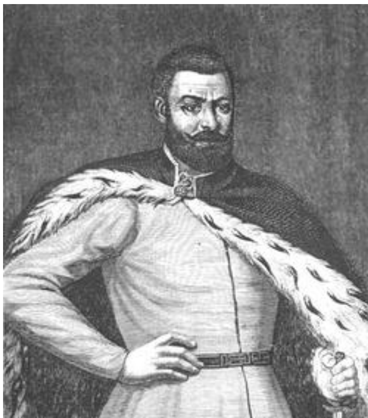
Рис. 6. Портрет гетьмана Григорія Ходькевича. Автор невідомий.

передсмертний заповіт. Через два дні, тобто 12 травня 1571 р. він помирає від хвороби. Спочатку його було поховано в місцевому костелі, але відповідно до забаганки в заповіті тіло князя перевозять до Свято-Миколаївського чоловічого монастиря в с. Мильці (рис. 7). Там вже покоїлась його дружина Олександра. Монастир здавна був родинною обителлю славного княжого роду Сангушків, адже його фундатором був Федір [15, 82]. Зокрема, відомо, що саме він побудував на території комплексу храм Святого Миколая. Федір Сангушко був відомим меценатом, який фінансував зведення інших святинь, таких як: Видубецький, Жидиченський та Зимненський монастирі. Довгий час не було відомо точного місця поховання князівського подружжя. І ось у 1997 р. час реставраційних робіт у Миколаївському храмі в Мильцях під підлогою знайшли останки шести ченців із рештками одягу та взуття. Існує версія, що серед них є мощі Романа та його дружини Олександри, які заповіли себе поховати в обителі.