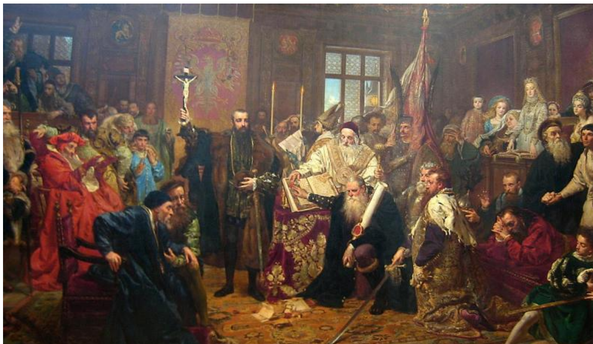
Рис. 4. Люблінська унія. Автор Ян Матейко (1869 р.).

1 червня під час свого виступу в сеймі заявив про готовність прийняти присягу на вірність Короні, за умови збереження привілеїв шляхти Волині і Брацлавщини. Така позиція визвала непорозуміння з іншими можновладцями ВКЛ. У акті Люблінської унії про цей факт записано так: «...обіцяємо зберегти у стародавній пошані і гідності, що властиві їм з прадавніх часів і донині, усіх княжат..., а також їхніх нащадків, як римської, так і грецької віри, і зобов'язуємося підносити їх на уряди відповідно до гідності і достоїнств кожного на підставі власного вибору...».