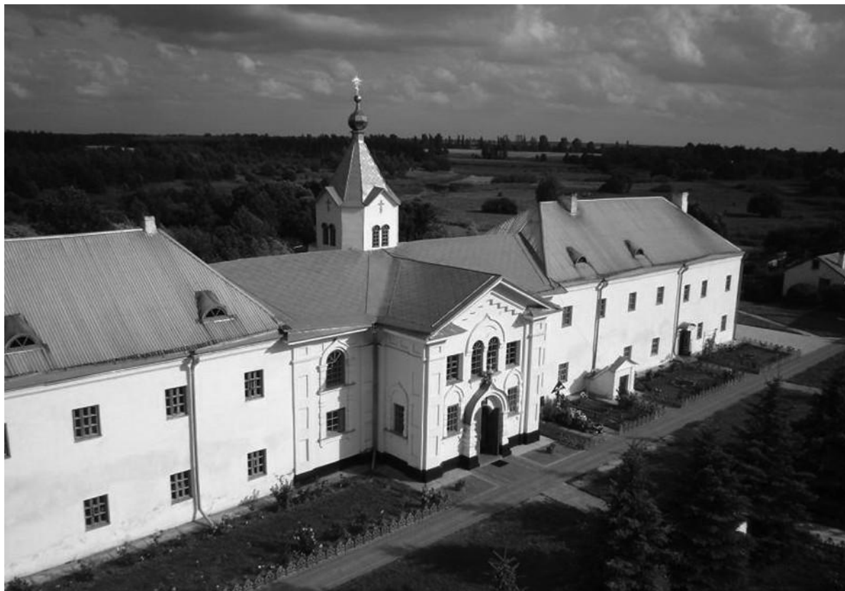
Рис. 7. Усипальниця князя Романа Сангушко. Миколаївський православний монастир в с. Мильці Старовижівського району Волинської області.

В його підпорядкуванні перебували землі, які сьогодні входять до Шацького району, про що свідчать інвентарі та описи Волинських земель і добрі справи князя, про якого і досі пам'ятають на Волині [7, 559; 8]. Саме з його постаттю пов'язують побудову дерев'яного православного храму Петра і Павла на території с. Світязь, який згорів у 1796 р. Цей храм був старий, але вже таки придатний для богослужіння. Сьогодні на його місці височіє нова мурована святиня.