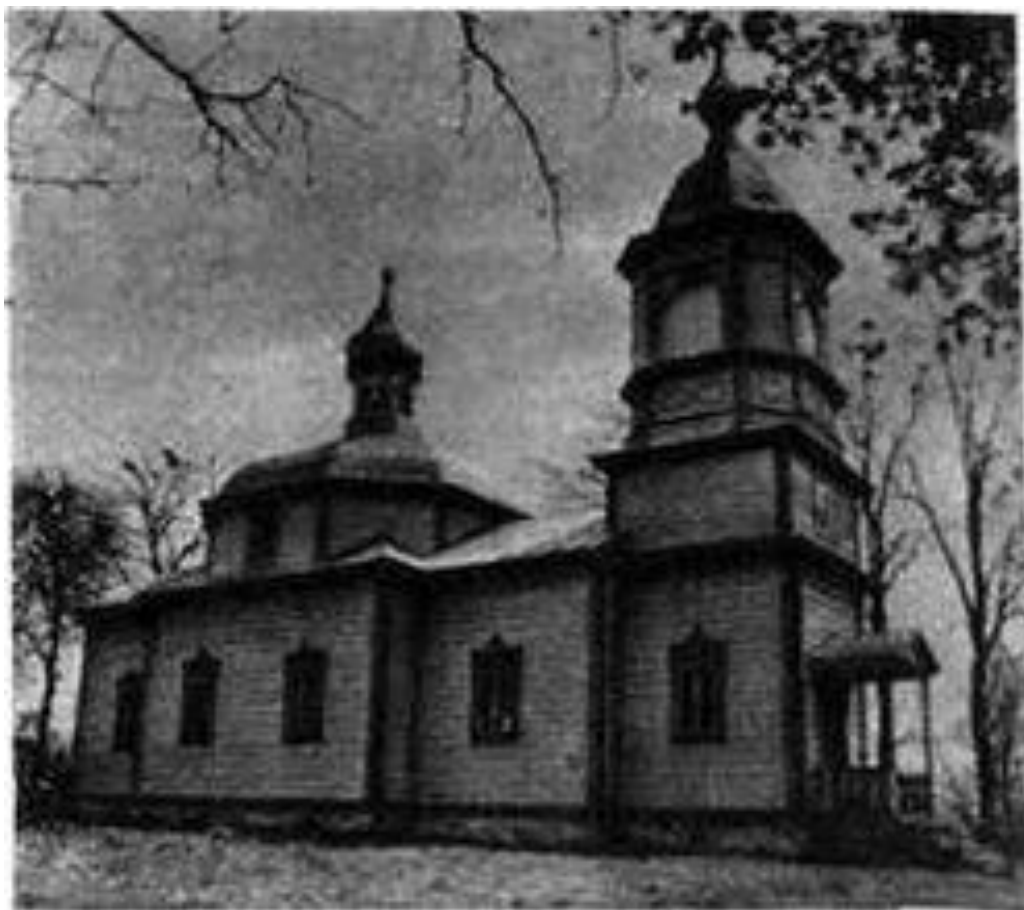
Храм святого апостола Луки с. Доросині