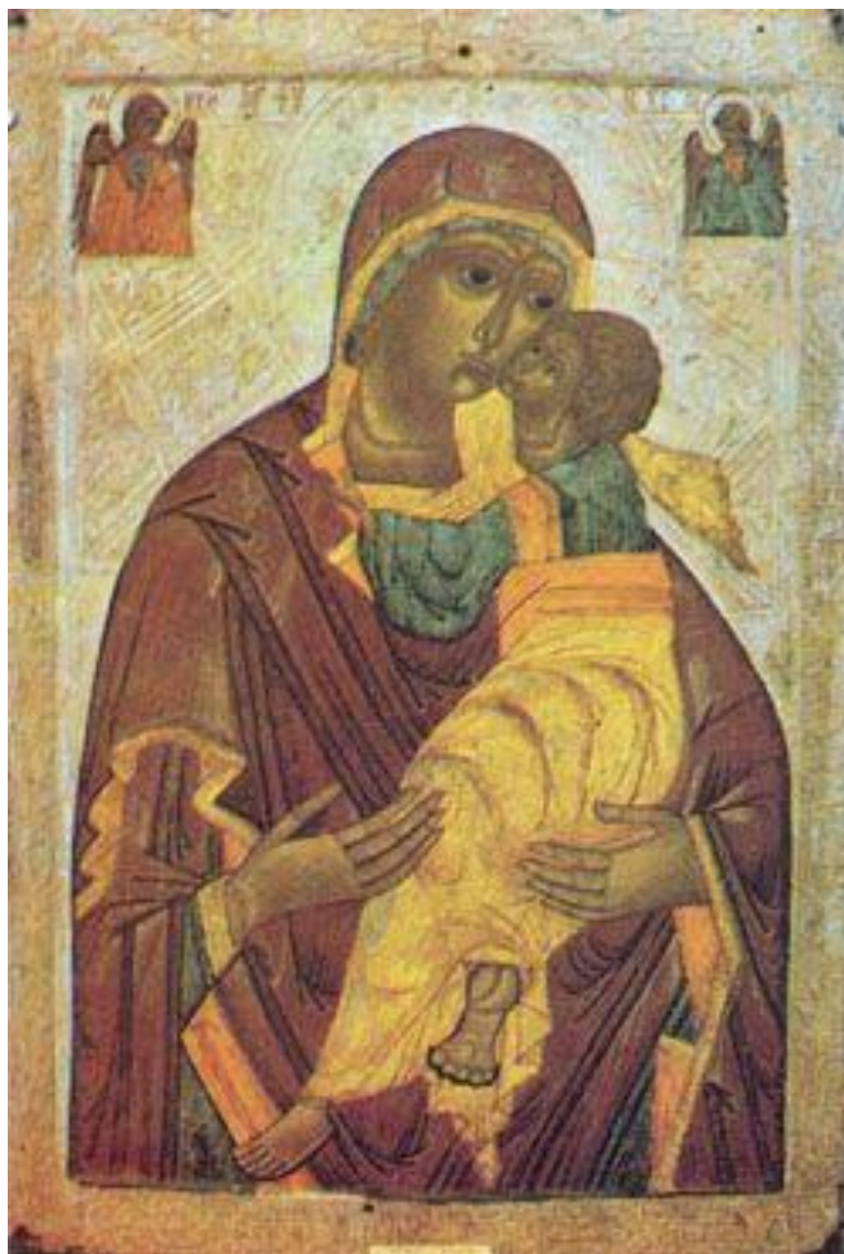
Ікона Богоматері-Елеуси XV ст. с. Доросині

© Федчук В. У музеї Доросинів – уся їхня 565-річна історія [Електронний ресурс]