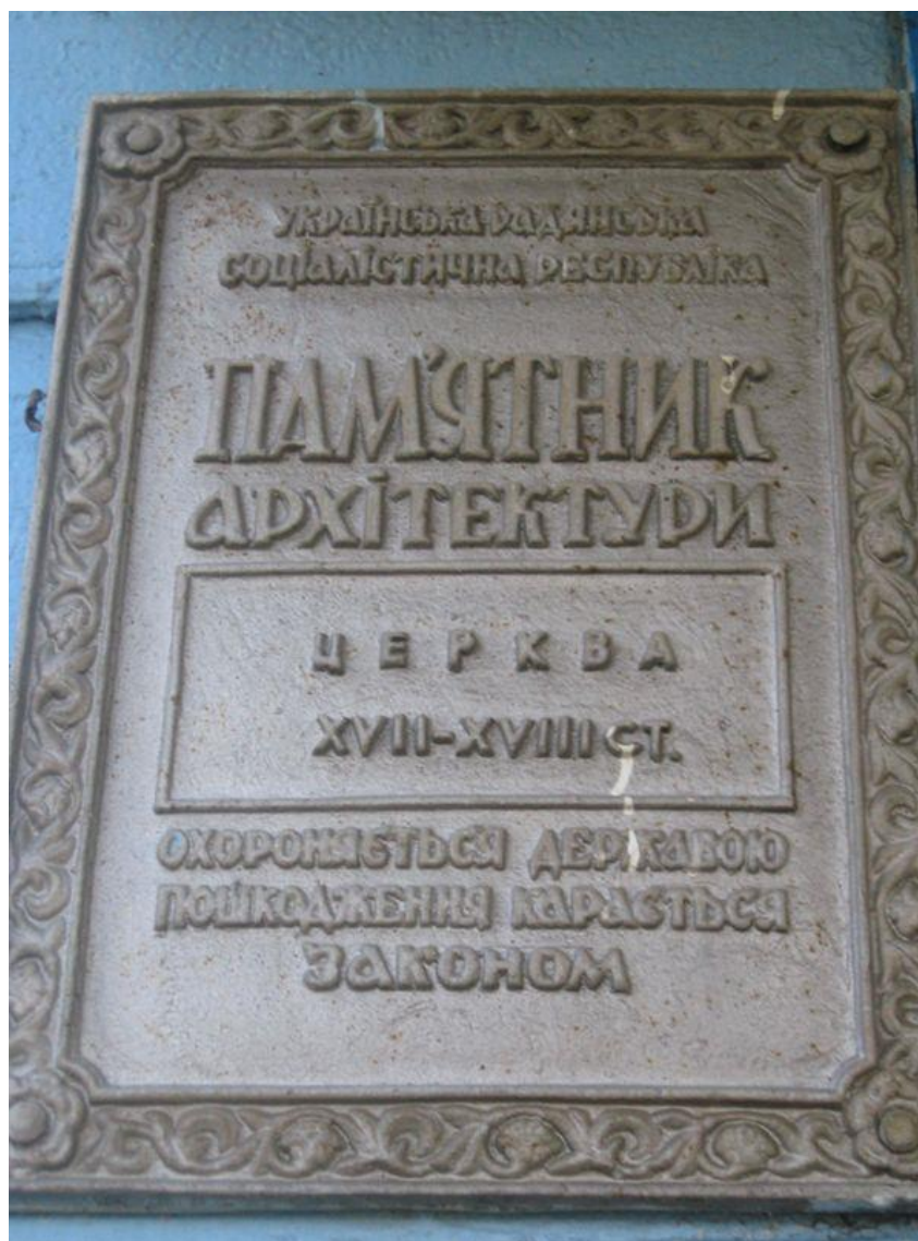
Охоронний знак храму святого апостола Луки с. Доросині