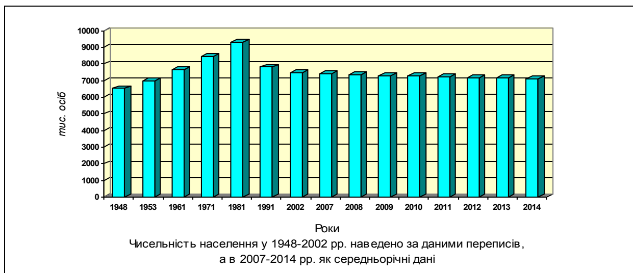
Рис. 1. Динаміка чисельності населення Сербії у 1948–2014 рр.

тенденцію до постійного його зменшення через те, що смертність значно переважала народжуваність. Якщо в країні в 1995 р. проживало 7,74 млн осіб (рис. 1), то на початок 2015 р. його чисельність зменшилася до 7,114 млн осіб.