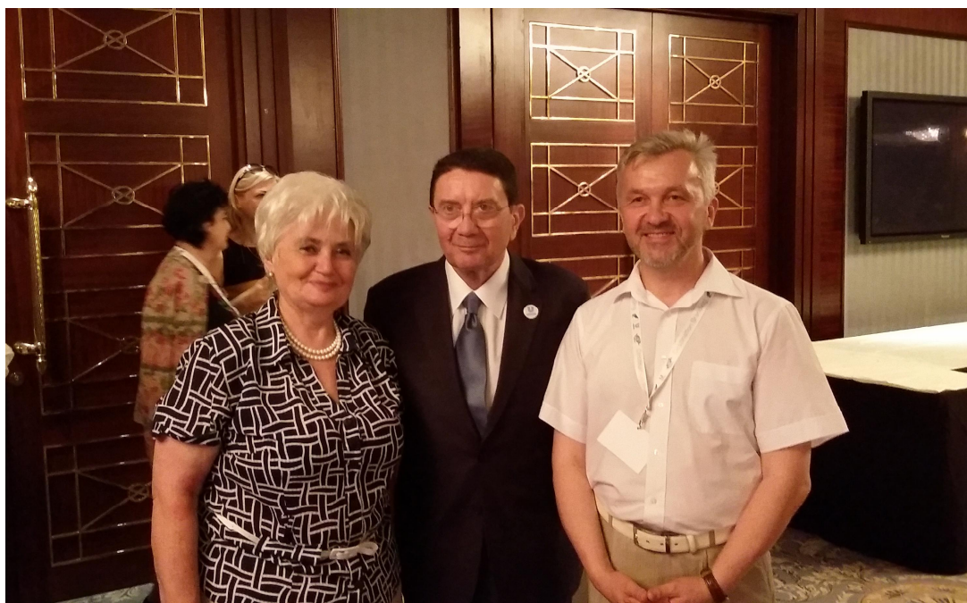
З Талемом Ріфаї, Генеральним секретарем Всесвітньої туристичної організації (UNWTO) (2016 р.)