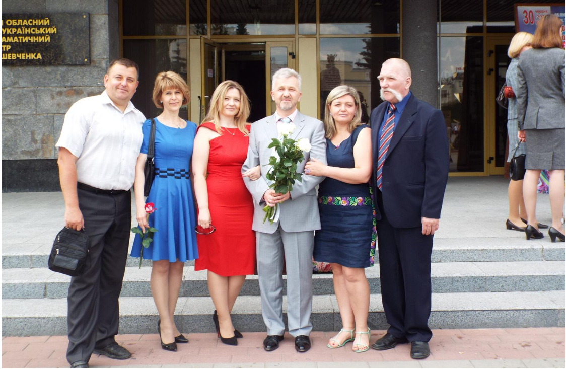
З членами кафедри туризму та готельного господарства (2016 р.)