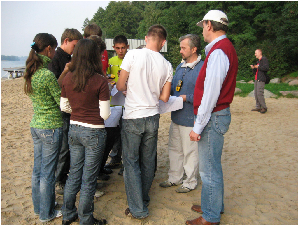
З проф. Зигмунтом Млінарчеком (Польща) під час практичних занять зі студентами СНУ ім. Лесі Українки (навчальна природничо-наукова практика, Великопольське Поозер'я, Польща)