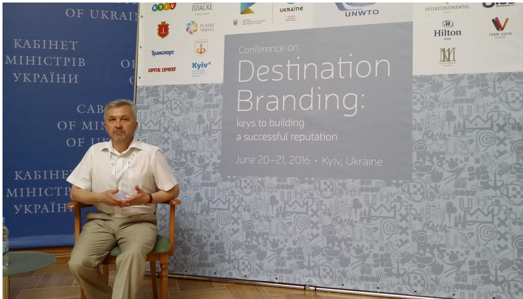
На засіданні наукової ради з туризму і курортів Міністерства економічного розвитку і торгівлі (21 червня 2016 р.)