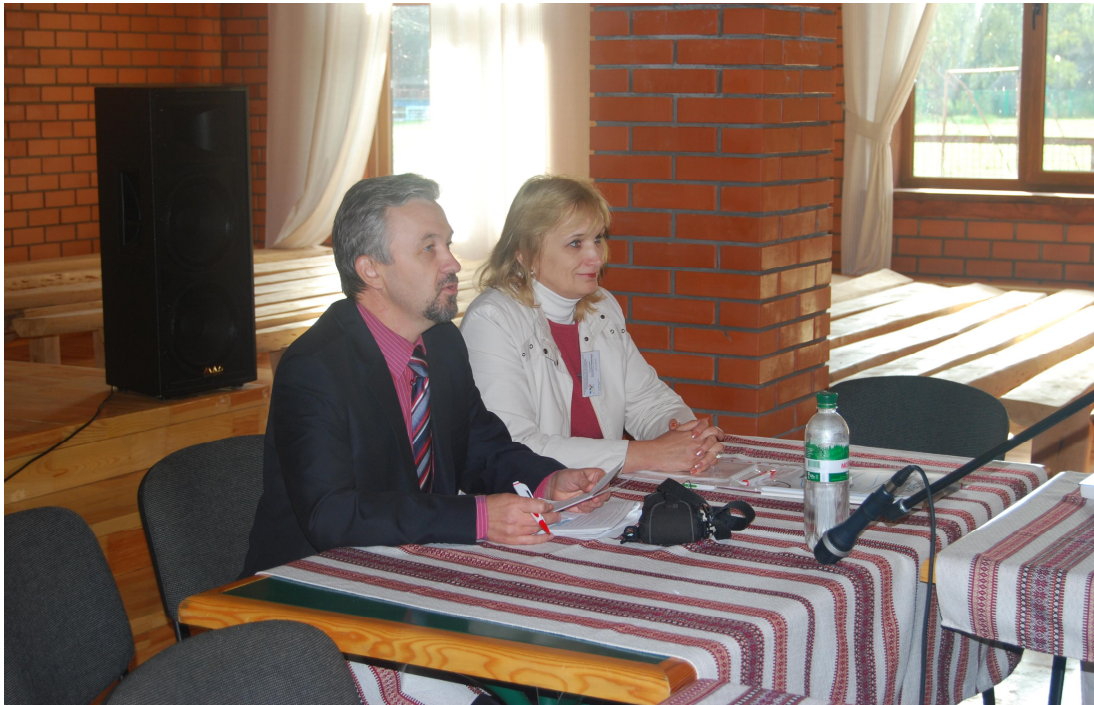
Під час Міжнародної науково-практичної конференції в Шацькому національному природному парку (2012 р. )