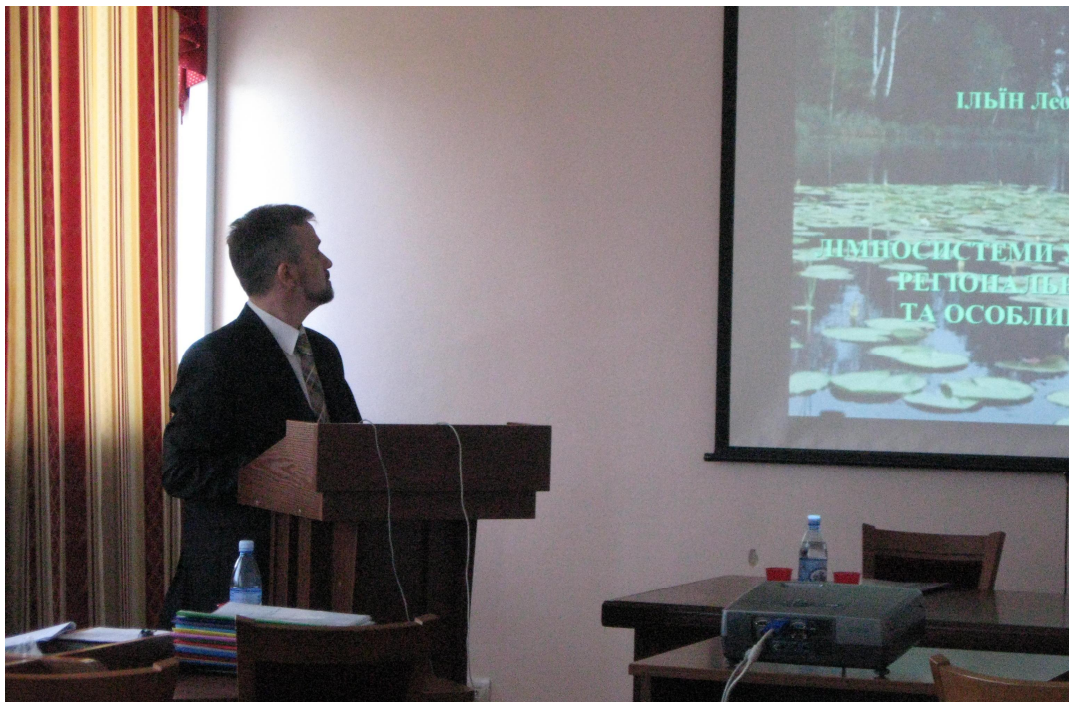
Захист докторської дисертації у Київському національному університеті імені Тараса Шевченка (25 травня 2009 р.)