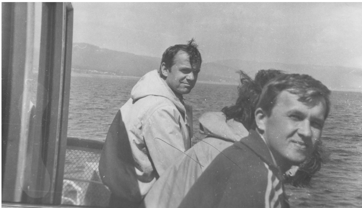
На озері Байкал (комплексна практика, 1990 р.)