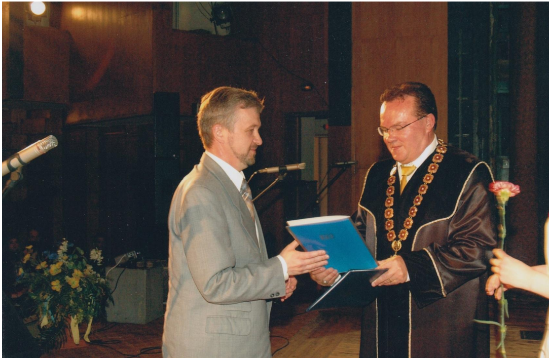
Вручення Почесної грамоти Міністерства освіти і науки України