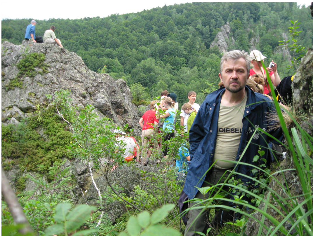
Навчальна природничо-наукова практика в Закарпатті