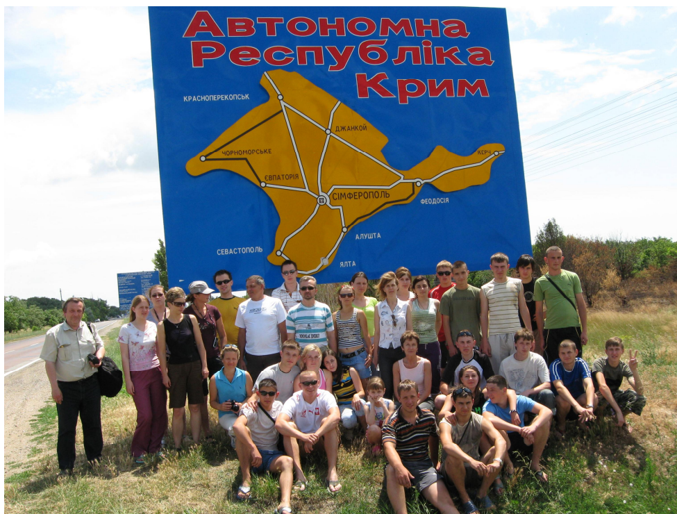
Спільна українсько-польська навчальна професійно-орієнтована практика студентів-туризмознавців СНУ ім. Лесі Українки та Університету ім. Адама Міцкевича в Познані (Польща)