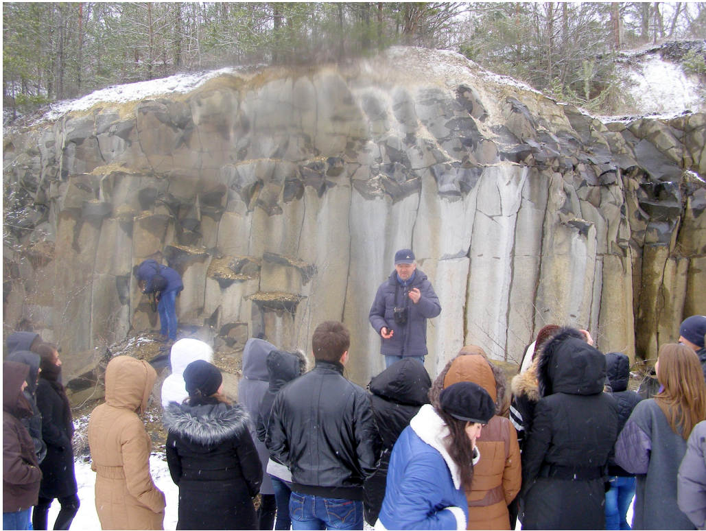
Заняття на виїзді (Рівненщина)