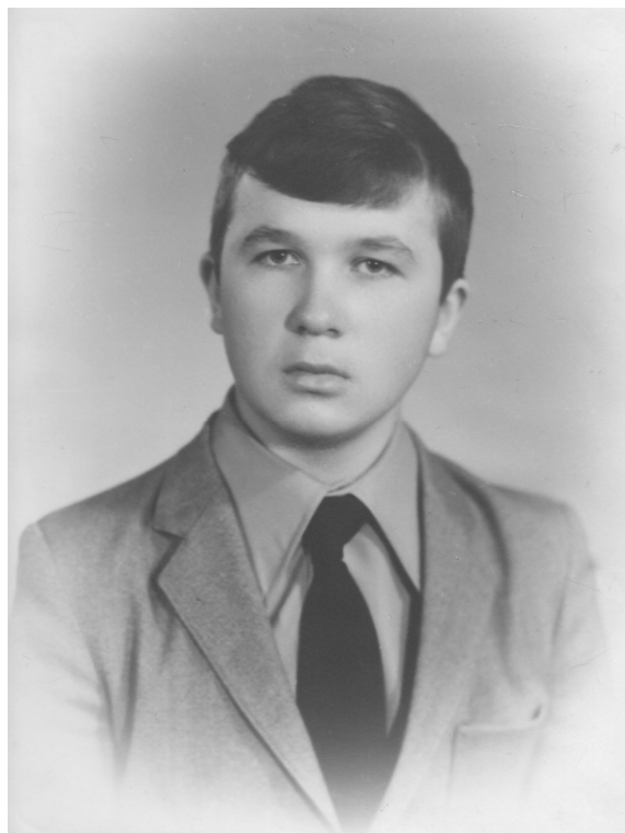
Випускник середньої школи (1984 р.)