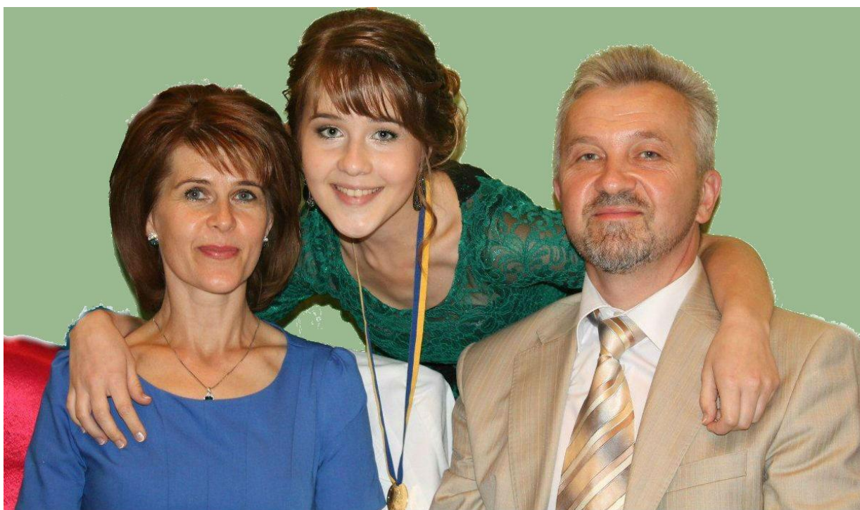
З дружиною та донькою