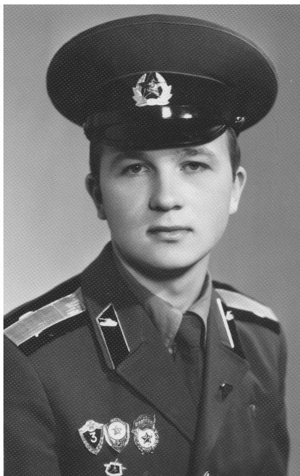
Старшина (Група радянських військ у Німеччині, 1987 р.)