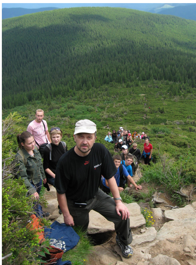
Навчальна природничо-наукова практика в Карпатському національному природному парку