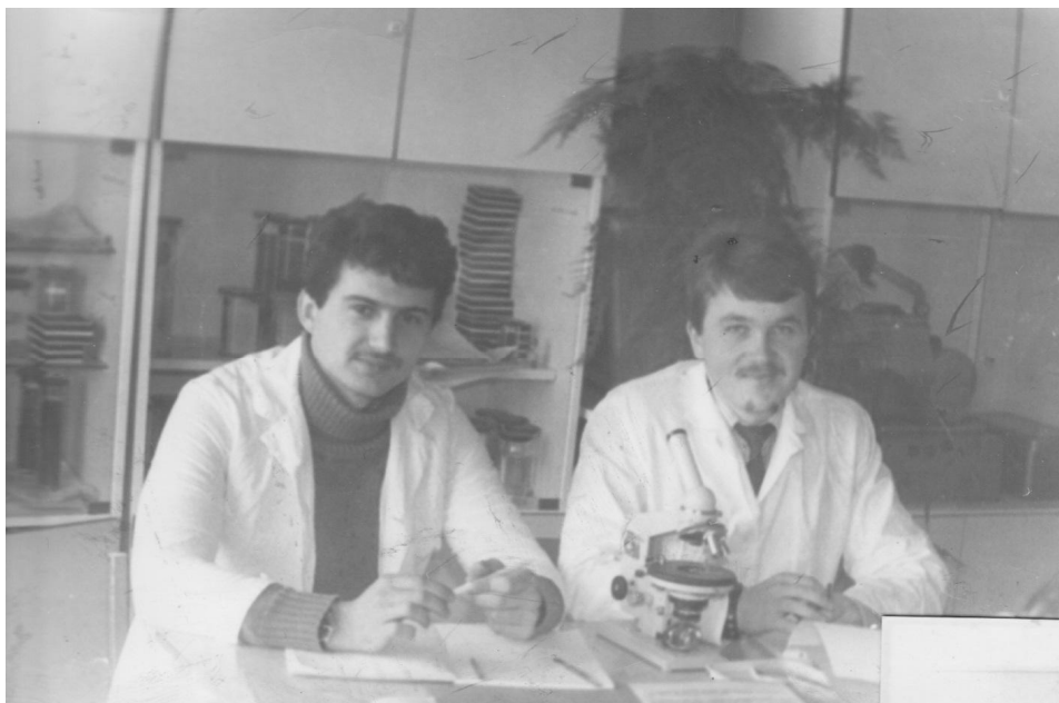
На практичному занятті (1988 р.)