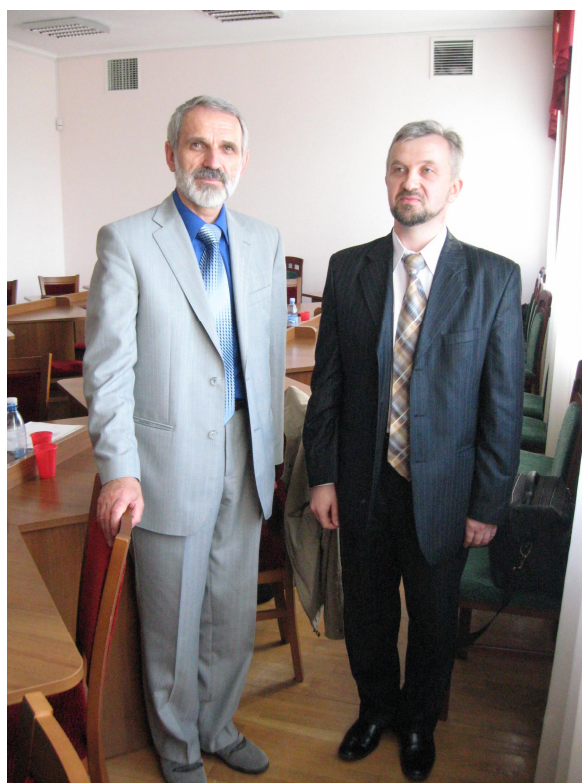
З членом Національної спілки письменників України, членом Президії Українського географічного товариства, головою Київського відділу УГТ, головним редактором «Київського географічного щорічника» проф. В. М. Пащенком (2009 р.)