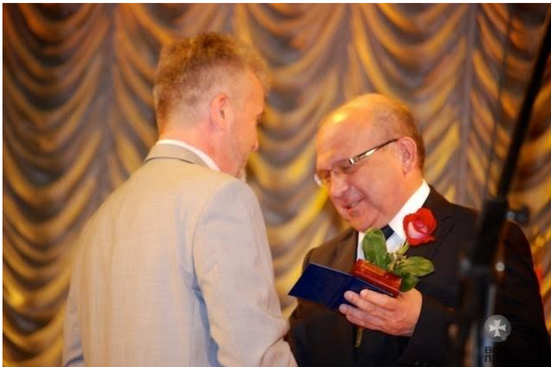
Вручення нагрудного знака «Відмінник освіти» (2016 р.)