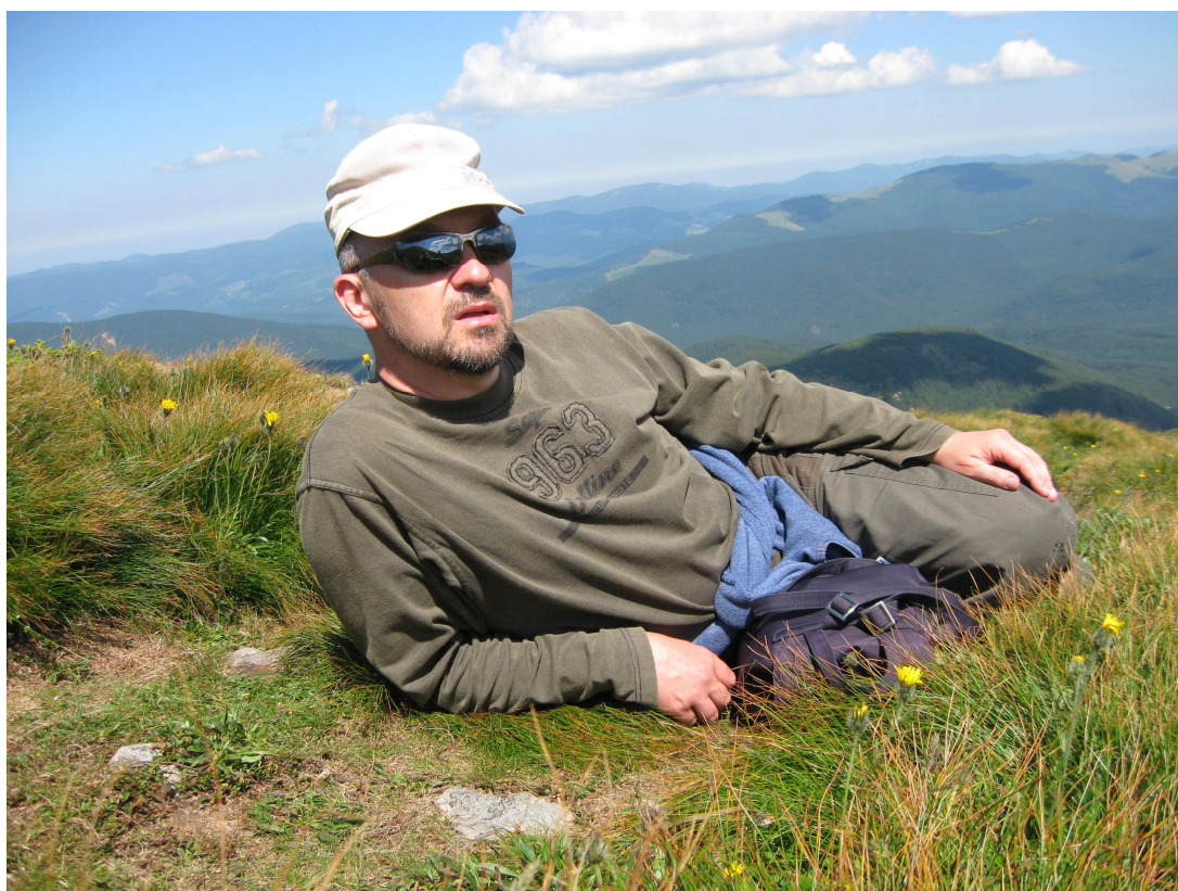
В Українських Карпатах