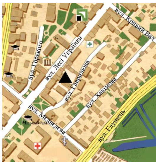
▲ Ймовірне місце розташування Пречистенського монастиря і храму

Монастир Успіння Пресвятої Богородиці (Пречистенський), як і однойменна церква на Святій горі знаходилися поблизу річки Глушець, там, де нині вулиця Гаврилюка в середмісті обласного центру Волині (рис. 1).