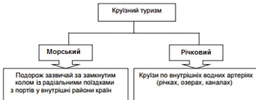
Рис. 1. Види туристських круїзів за характеристикою водного простору

Особливістю круїзного туризму є те, що транспортний засіб бере безпосередню участь в обслуговуванні туристів під час здійснення круїзу. Крім того, цей транспортний засіб виступає не тільки засобом переміщення туристів по туристському маршруту, а й місцем проживання, харчування, оздоровлення, освіти, отримання розваг туристом. Водний вид транспорту в круїзному туризмі виступає базовим елементом туристського продукту, тому що під час круїзу туриста не тільки транспортують, а й надають повний спектр додаткових послуг. Круїзний туризм поділяється на морський та річковий (рис. 1). Під час розробки турпродукту туроператор має враховувати природні ресурси місцевості, тому що від водних ресурсів буде залежати різновид круїзу. Безперечно, засіб перевезення туристів має бути обладнаний та спроектований згідно з уподобаннями споживача, щоб залишатися конкурентоспроможним за ринкових умов [1].