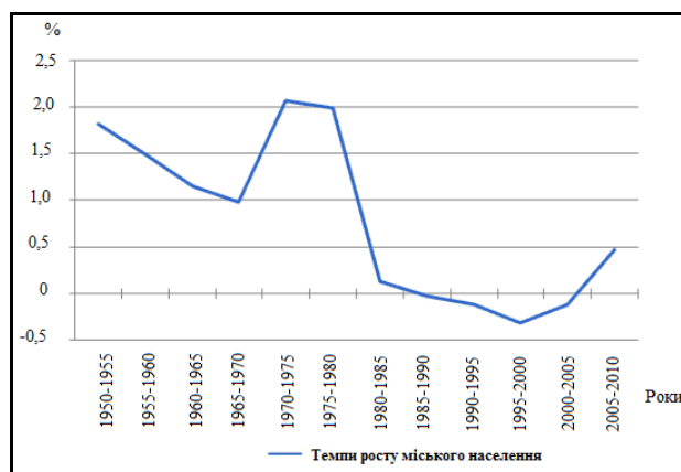
Рис. 1. Динаміка середніх темпів росту міського населення в Чеській Республіці у 1950–2010 рр.