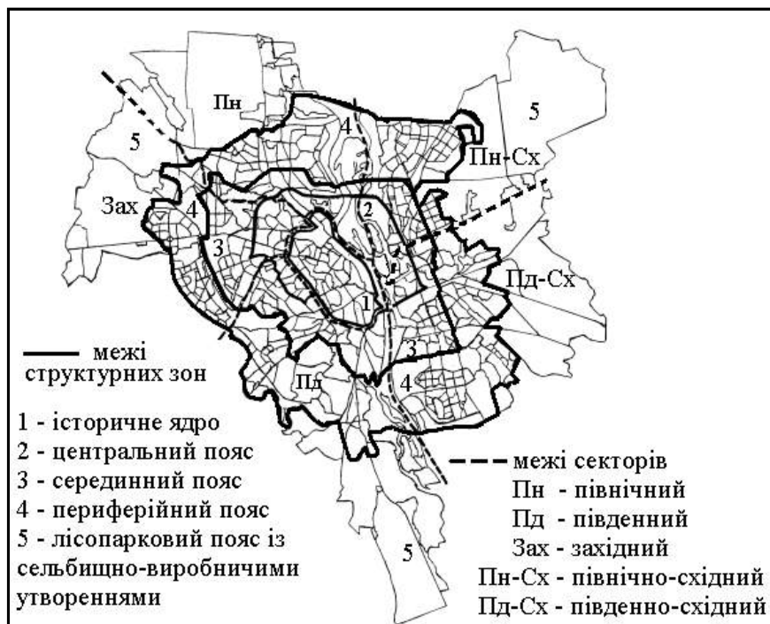
Рис. 2. Поясно-секторна структура міста Києва

Великі міста формують ареали суцільної забудови, які забезпечують розселенську, виробничу, транспортну й обслуговуючу функції. Однак ці функції розміщені нерівномірно. Виділяють принаймні чотири пояси господарської спеціалізації великого міста: історичне ядро, центральна зона, периферійна зона та лісопарковий пояс [3; 8]. Розглянемо ці зони на прикладі міста Києва (рис. 2).