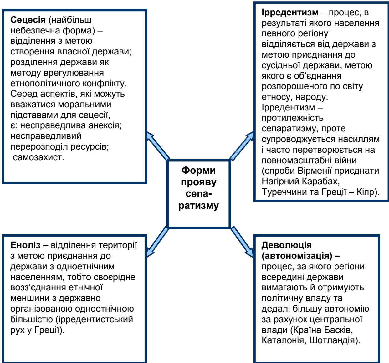
Рис. 2. Форми прояву сепаратизму залежності від цілей, які ставлять лідери сепаратистських рухів

На сьогодні нові підстави для штучного нагнітання сепаратистських настроїв у певних регіонах світу породжує розширення комунікативних можливостей у постіндустріальному світі [2, с. 281]. Можна дійти висновку, що в суспільстві з вищим рівнем політичної культури та економічного добробуту етнічний сепаратизм має значно менше шансів розвиватися у стрімких та гострих проявах.