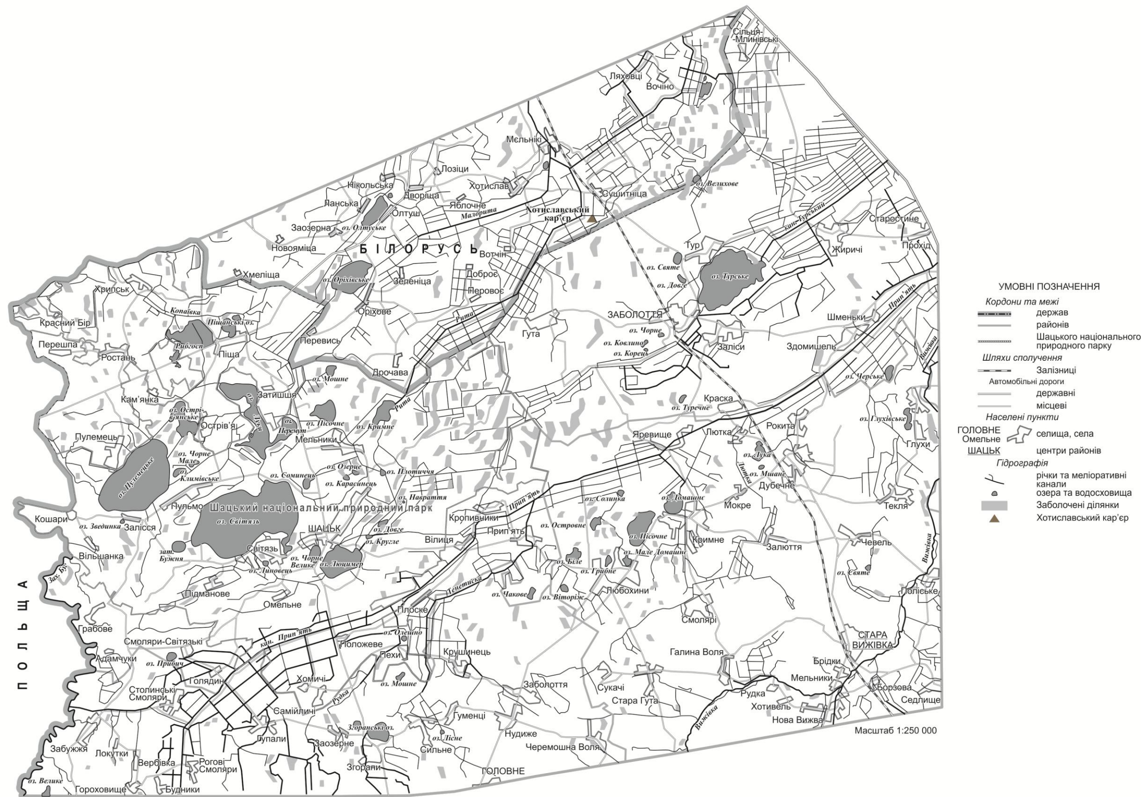
Рис. 7.4. Заболочення станом на 2008 р. (склала О. В. Антипюк)