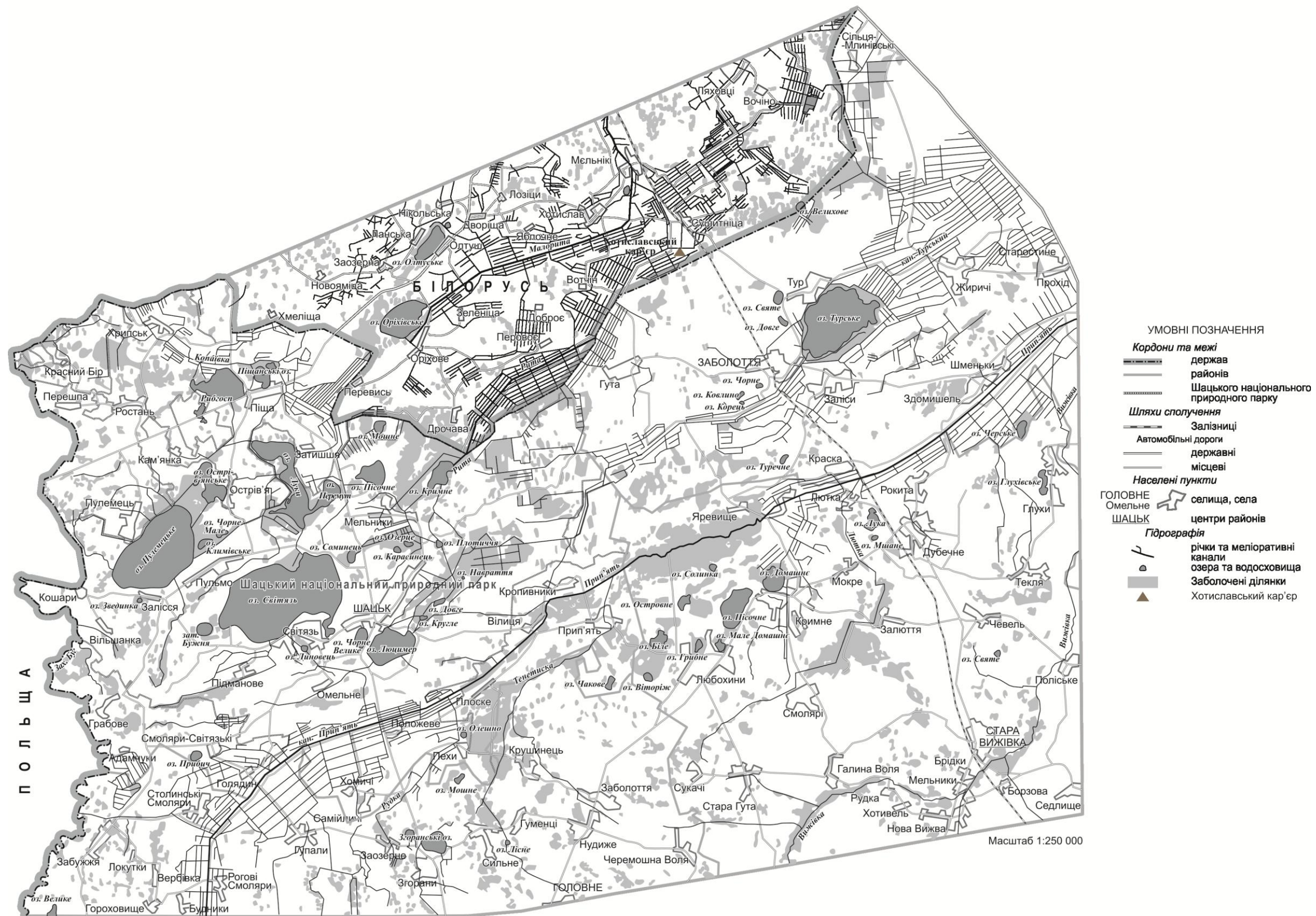
Рис. 7.3. Заболочення станом на 1975 р. (склала О. В. Антипюк)