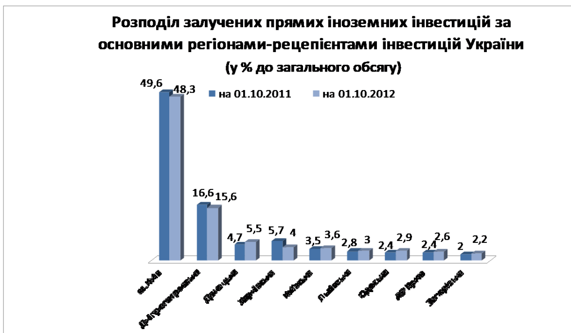
Рис. 3.4. Розподіл залучених прямих іноземних інвестицій за основними регіонами-реципієнтами інвестицій в Україні [13]

Приросту капітальних інвестицій у січні - вересні 2012 року досягнуто в 19 регіонах. Найбільш активно у січні - вересні 2012 року освоювались капіталовкладення в Кіровоградській області (168,7 % у порівнянні з відповідним періодом попереднього року), Одеській (157,1 %), Полтавській (149,0 %), Донецькій (136,4 %), Київській (136,3 %), Тернопільській (135,7 %), Харківській (134,3 %), Рівненській (133,6 %), Луганській (129,4 %), Волинській (128,2 %). Найбільший спад інвестиційної активності відбувався у Хмельницькій області (82,0 %)