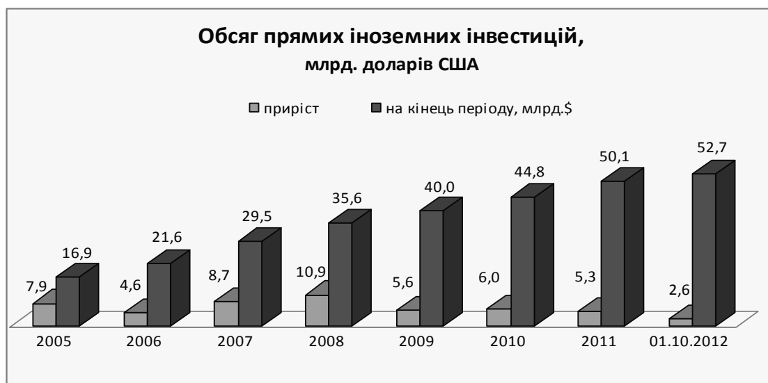
Рис. 3.1. Динаміка прямих іноземних інвестицій в Україну [13]

Характеризуючи сучасний стан інвестицій в Україні, слід зазначити, що за даними Держкомстату в січні – вересні 2012 року в вітчизняну економіку іноземними інвесторами було вкладено 4,3 млрд.дол.США прямих іноземних інвестицій, що становить 91,07 % до відповідного періоду 2011 року.