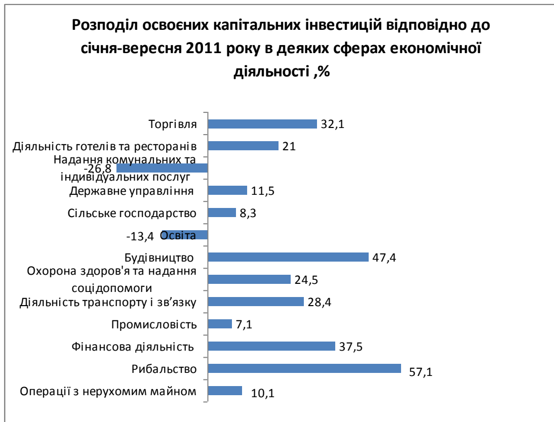
Рис. 3.6. Розподіл освоєних капітальних інвестицій в деяких сферах економічної діяльності у 2012 р. [13]

Так, за січень-вересень 2012 року порівняно з відповідним періодом 2011 року обсяги капітальних інвестицій у промисловість зросли на 7,1 %. Це, насамперед, зумовлено збільшенням (на 24,5 %) інвестицій у розвиток добувної промисловості та (на 4,5 %) в підприємства з виробництва і розподілення електроенергії, газу та води, частка яких становила 11,1 та 8,2 % від усіх капіталовкладень у промисловість відповідно. Інвестиції у розвиток переробної промисловості зменшились на 2,1 %.