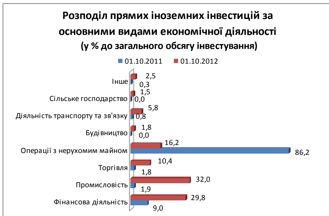
Рис. 3.2. Розподіл прямих іноземних інвестицій в Україну за основними видами економічної діяльності [13]

На підприємствах промисловості зосереджено 16866,0 млн.дол.США (32,0%), у т.ч. переробної – 13935,8 млн.дол.США, з виробництва та розподілення електроенергії, газу та води – 1506,6 млн.дол.США, добувної – 1423,5 млн.дол.США. Серед галузей переробної промисловості у підприємства металургійного виробництва та виробництва готових металевих виробів унесено 6136,6 млн.дол.США прямих інвестицій, виробництва харчових продуктів, напоїв і тютюнових виробів – 2995,3 млн.дол.США, хімічної та нафтохімічної промисловості – 1320,6 млн.дол.США, машинобудування – 1155,5 млн.дол.США, виробництва іншої неметалевої мінеральної продукції – 1012,7 млн.дол.США.