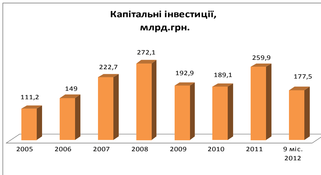
Рис. 3.5. Динаміка капітальних інвестицій в Україні [13]

Аналіз динаміки освоєних капітальних інвестицій свідчить про спад темпів їх зростання.