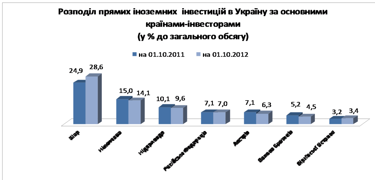
Рис. 3.3. Розподіл прямих іноземних інвестицій в Україну за основними країнами-інвесторами [13]

До десятки основних країн-інвесторів, на які припадає 82 % загального обсягу прямих інвестицій, входять: Кіпр – 15075,5 млн.дол.США, Німеччина – 7432,7 млн.дол.США, Нідерланди – 5040,8 млн.дол.США, Російська Федерація – 3706,1 млн.дол.США, Австрія – 3300,7 млн.дол.США, Велика Британія – 2396,0 млн.дол.США, Віргінські Острови (Брит.) – 1805,7 млн.дол.США, Франція – 1796,8 млн.дол.США, Швеція – 1578,6 млн.дол.США та Швейцарія – 1085,1 млн.дол.США.